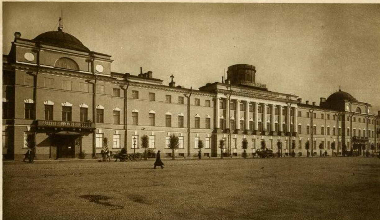
Фото-тинто-гравюра Т-ва „Образование“.

В. ВОЛКОВЪ. (1755-1803 Г.) МОРСКОЙ КОРПУСЪ НА ВАСИЛЬЕВСКОМЪ ОСТРОВѢ. 1795 Г.