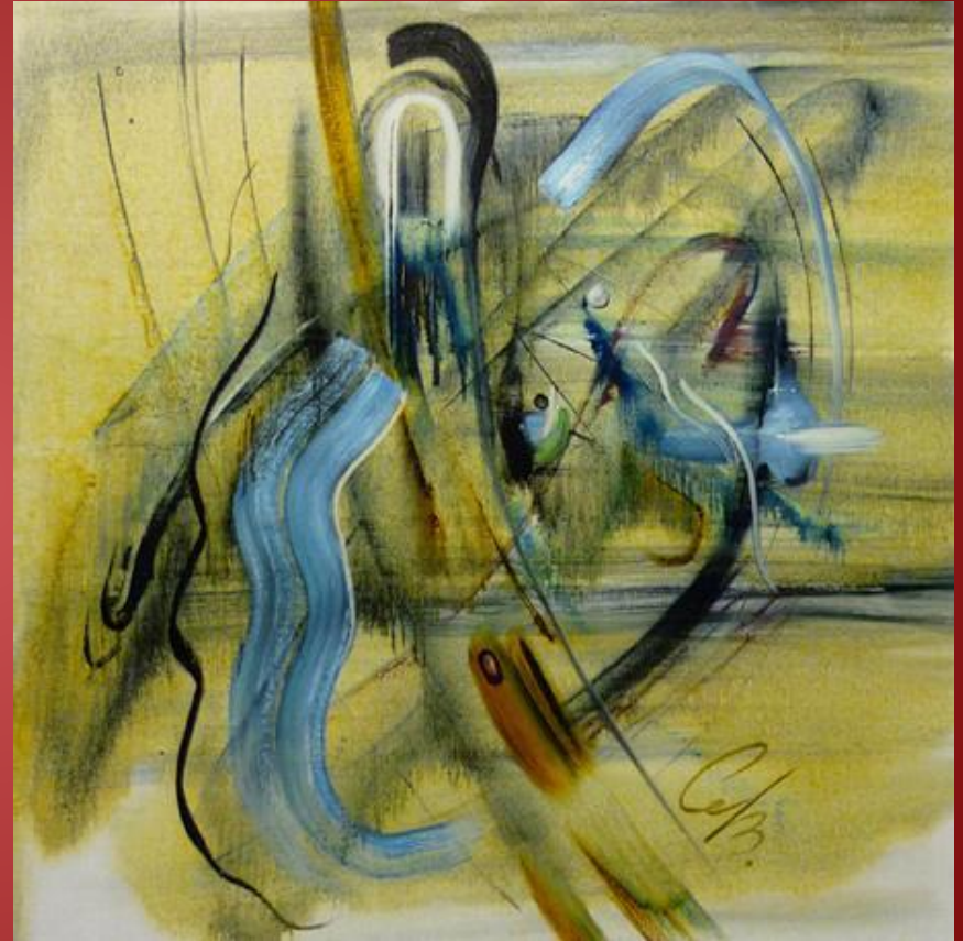
В.Ленивкин «Музыка Шнитке».

Новый стиль в музыке позволял удерживать и сохранять в современном творчестве одновременно любые исторические и социальные стили.