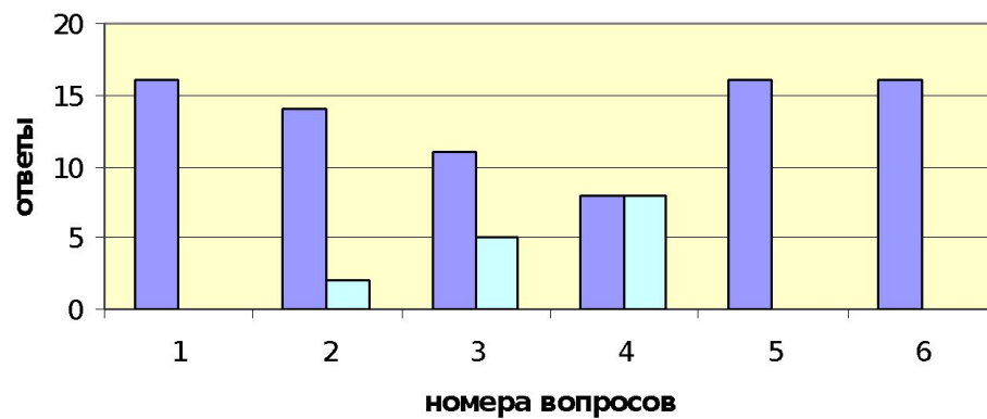
возраст 18 - 40 лет