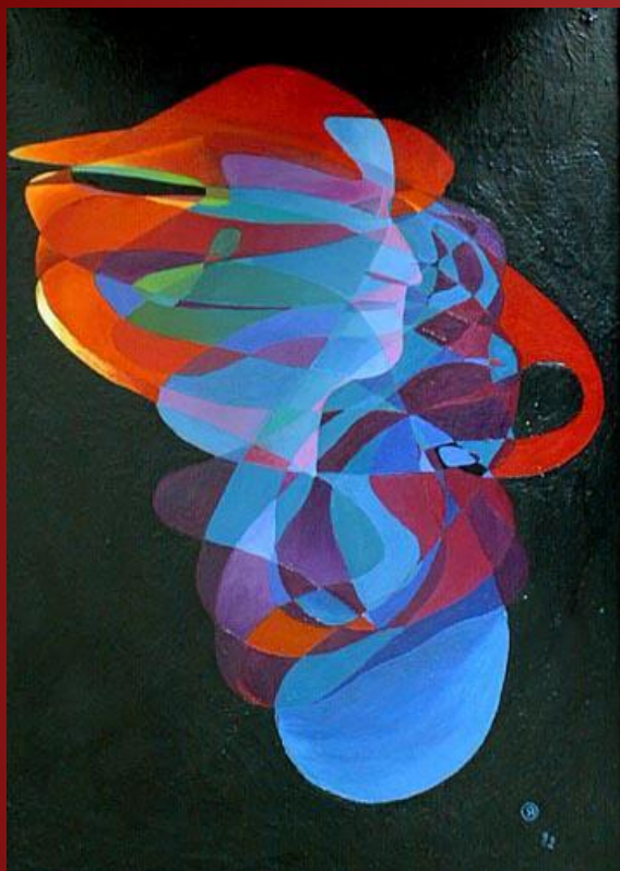
О.Языков, «Портрет художника. Памяти Шнитке».