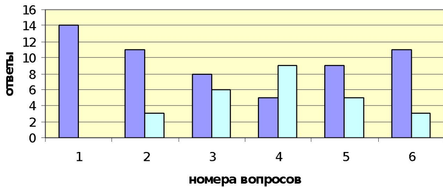
Возраст до 17 лет