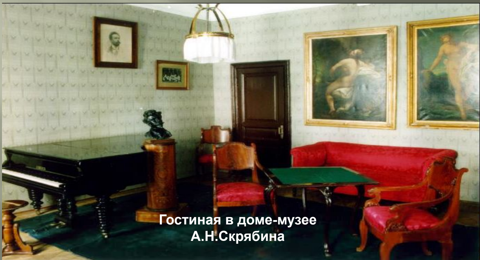
Гостиная в доме-музее А.Н.Скрябина

Творчество Скрябина оказало существенное воздействие на фортепианную и симфоническую музыку 20 в. Получили дальнейшее развитие идеи синтеза музыки и света. В 1922 в помещении последней квартиры Скрябина в Москве организован музей.