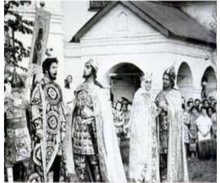
Сцена из оперы "Князь Игорь". Самарский театр в декорациях Ярославского кремля.