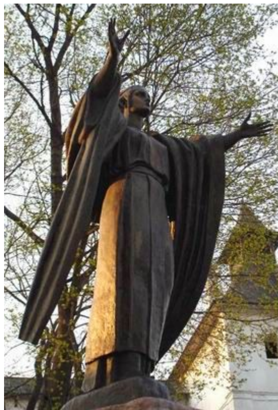
Город Путивль. Памятник Ярославне