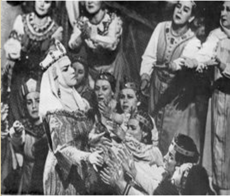
Сцена из оперы "Князь Игорь" Государственный Большой академический театр.