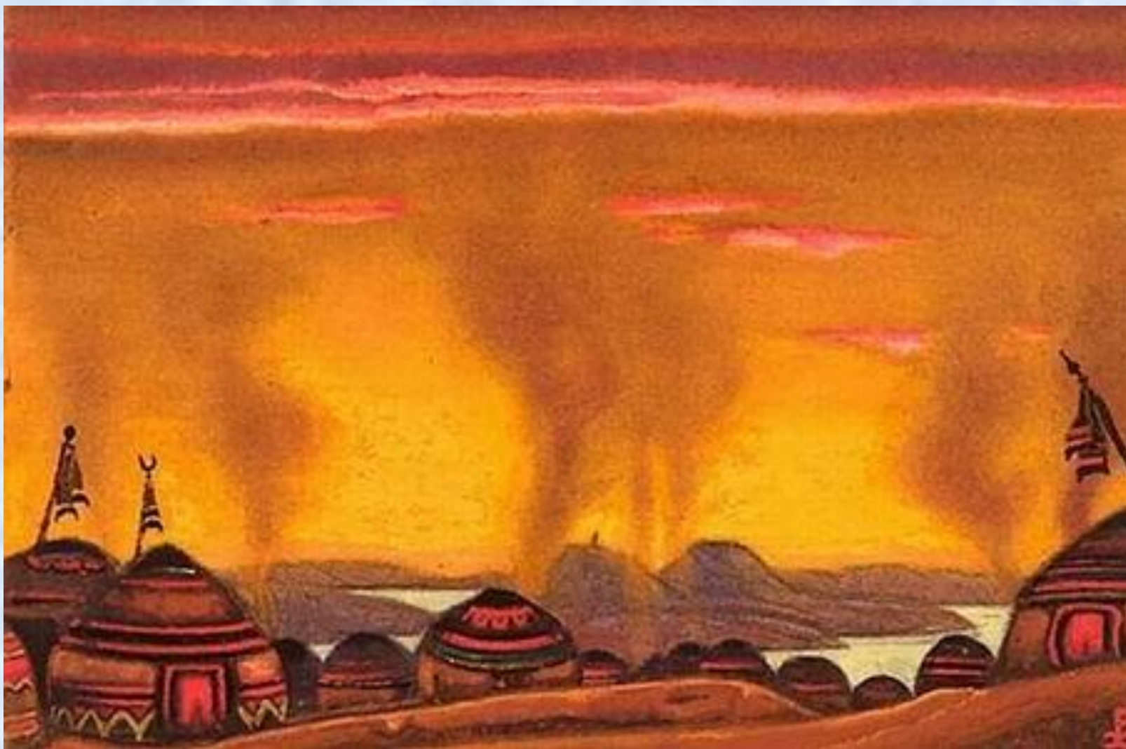
Н.К. Рерих. Половецкий стан. Эскиз к половецким пляскам из оперы А. П. Бородина "Князь Игорь".