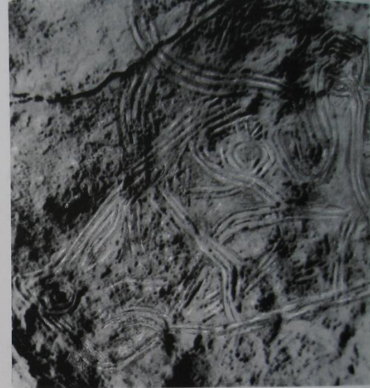
63 Группы параллельных линий. Прочерчены пальцами по глине. Пещера Альтамира, Испания