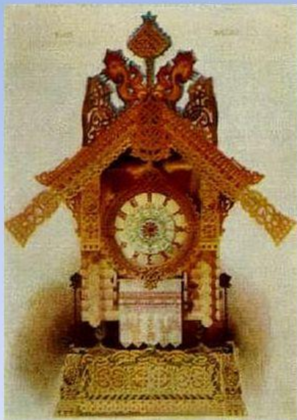
В. А. Гартман. Часы в русском стиле.