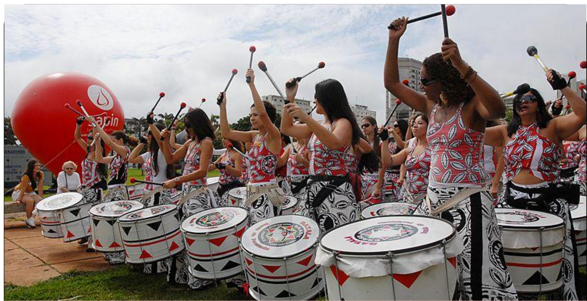
Коллектив бразильских барабанищиц