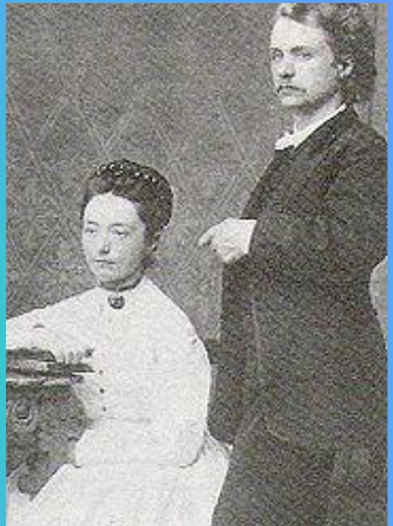
Эдвард Григ с супругой Ниной Хагеруп – знаменитой певицей