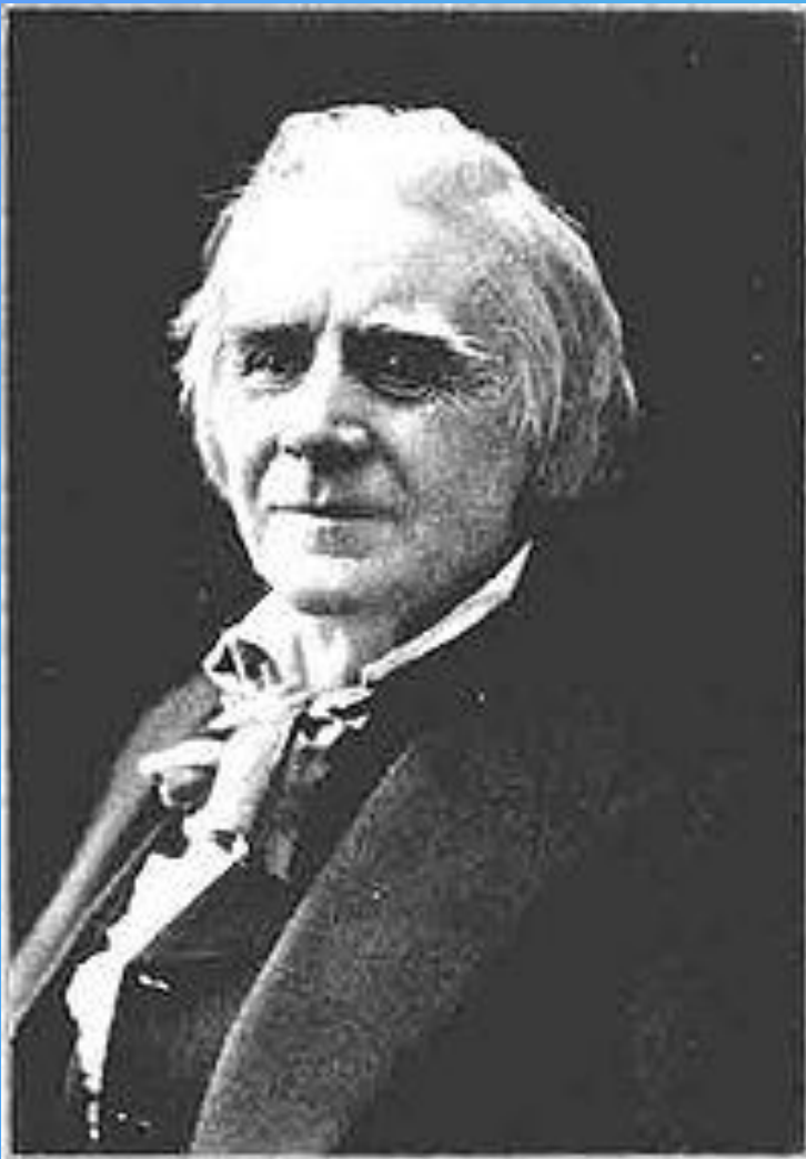
Первый из музыкантов, кто определил судьбу Грига —, знаменитый скрипач Оле Булл