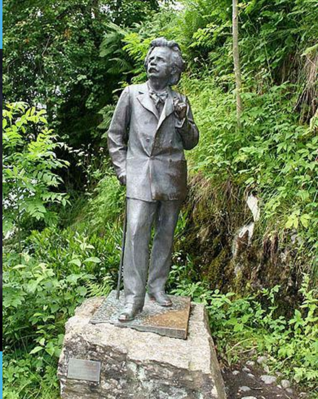
Памятник Эдварду Григу