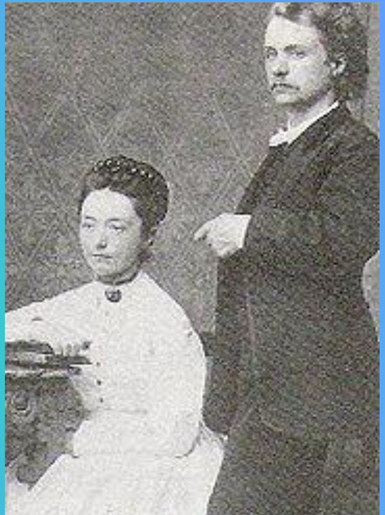
Эдвард Григ с супругой Ниной Хагеруп – знаменитой певицей