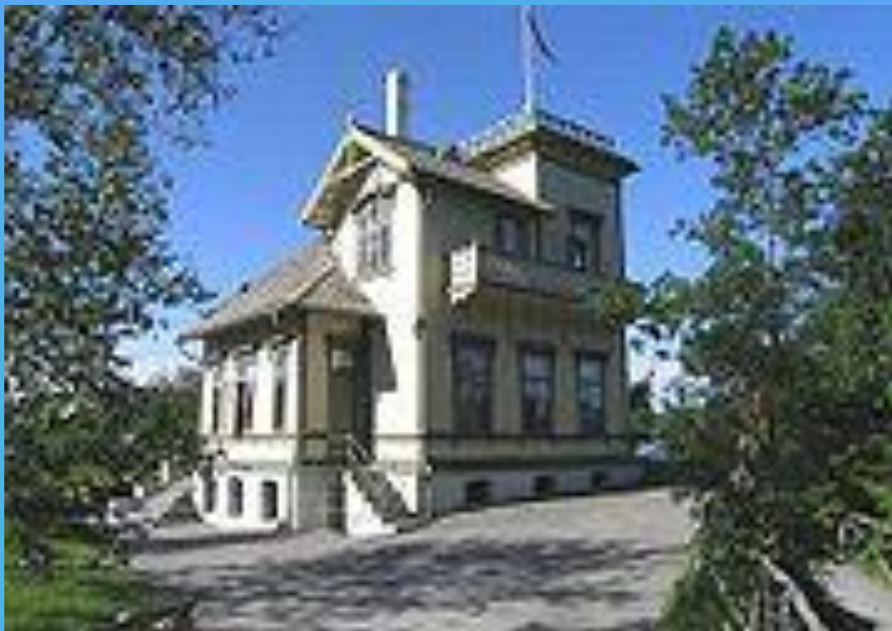
Дом-музей Эдварда Грига - Тролдхауген (Холм Троллей)

Григ опубликовал 637 песен и романсов. Посмертно издано ещё около двадцати пьес Грига. В своей лирике он обращался почти исключительно к поэтам Дании и Норвегии, и изредка к немецкой поэзии (Г. Гейне, А. Шамиссо, Л. Уланда). Композитор проявлял интерес к скандинавской литературе, и в особенности к литературе родного языка.