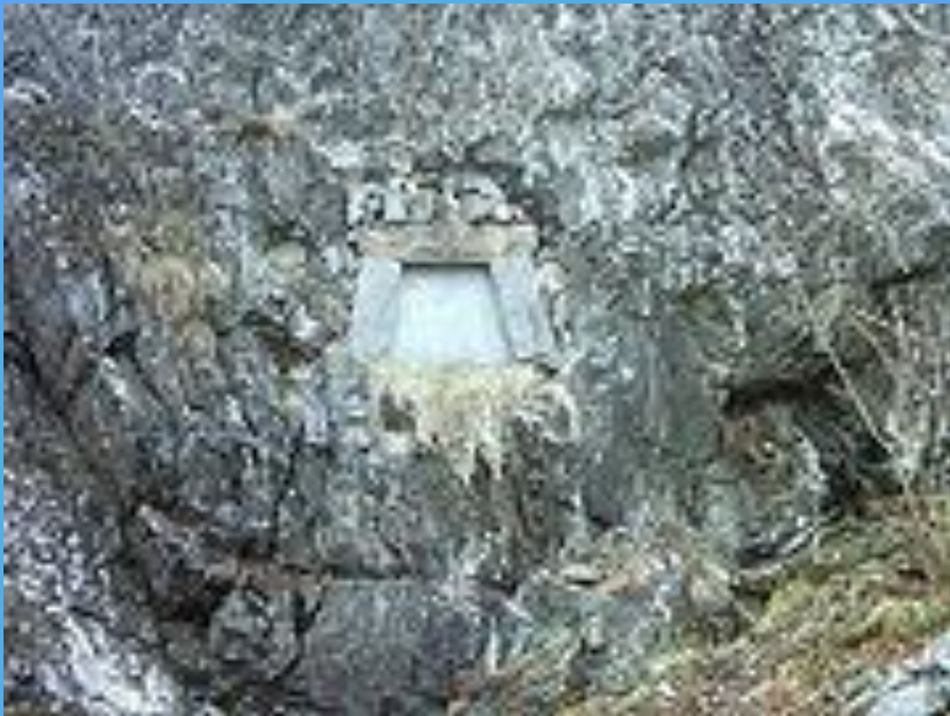
Могила Эдварда Грига и Нины Хагеруп

Григ скончался в родном городе — Бергене — 4 сентября 1907 года в Норвегии. Композитор похоронен в одной могиле с женой Ниной Хагеруп.