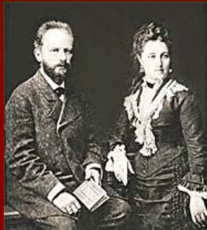
П. И. Чайковский с женой.

Личная жизнь композитора не складывалась. В 1877 он женился на А. И. Милюковой. Брак этот оказался крайне несчастливый; связанные с ним переживания чуть не довели Чайковского до самоубийства. В 1878 он фактически бежал из России и в течение нескольких лет жил преимущественно за границей (главным образом в Швейцарии и Италии).