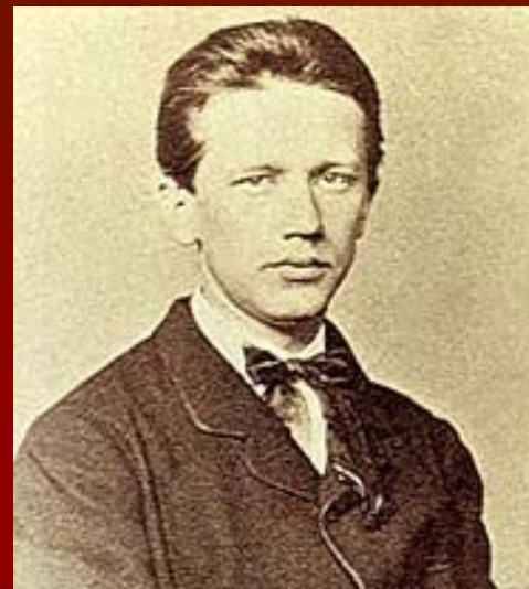
Петр Ильич Чайковский в 1862 году. Фотография.

утвердившая место Чайковского среди крупнейших симфонистов мира.