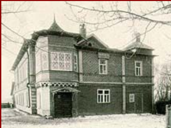
Дом П. И. Чайковского в Клину. 1893 год.

В конце 1870-х гг. Чайковский уходит из консерватории и едет за границу. В середине 1880-х гг. Чайковский возвращается к активной музыкально-общественной деятельности в России (в 1885 он был избран директором Московского отделения Русского музыкального общества). Тогда же он поселился под Москвой: сначала в селе Майданово, затем во Фроловском — оба близ Клина, а в 1892 — в Клину. Вместе с тем его скитальческой натуре по-прежнему была необходима перемена мест.