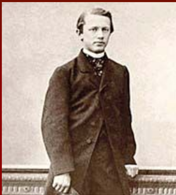
Петр Чайковский в 1859 году.