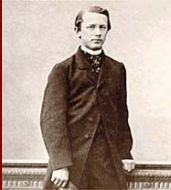
Петр Чайковский в 1859 году.