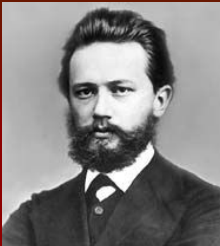
Петр Ильич Чайковский в 1869 году. Фотография.

Именем Чайковского названы (1940) Московская и Киевская консерватории, концертный зал в Москве; с 1958 в Москве каждые 4 года проводится Международный конкурс имени Чайковского.