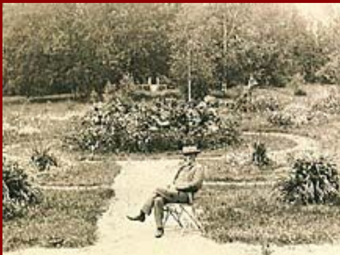
Петр Ильич Чайковский во Фроловском

Во второй половине 1880-х начинается дирижерская деятельность Чайковского — сначала в России, а потом за границей; в качестве исполнителя собственных произведений он посещает Германию, Австро-Венгрию, Францию, Англию, Швейцарию. Концертные поездки укрепили его творческие и дружеские связи с ведущими музыкантами эпохи, в том числе с Э. Григом, А. Дворжаком, Г. фон Бюловом. Зимы композитор проводит, как правило, за границей, лето — в основном на родине.