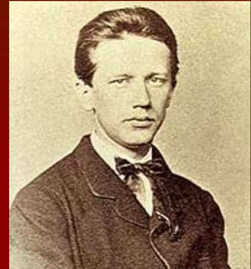
Петр Ильич Чайковский в 1862 году. Фотография.

утвердившая место Чайковского среди крупнейших симфонистов мира.