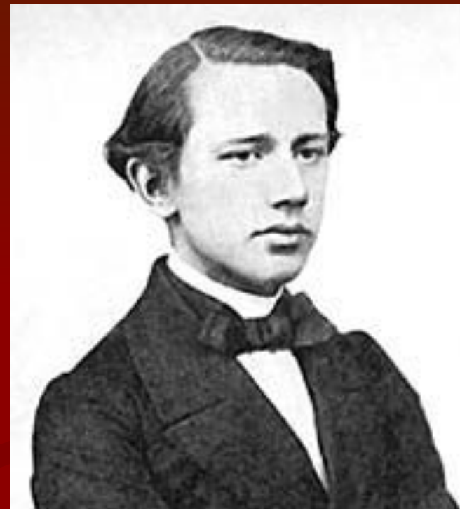
Петр Чайковский в 1860-е годы. Фотография.

Лишь в 1861 Чайковский приступил к серьезным занятиям в музыкальных классах Петербургского отделения Русского музыкального общества. Осенью 1862 он стал студентом преобразованной из музыкальных классов Петербургской консерватории, которую с отличием окончил в 1865 по классам А. Г. Рубинштейна, высоко ценившего талант ученика, и Н. И. Зарембы. Тогда же были написаны первые крупные сочинения для симфонического оркестра: увертюра «Гроза» (к драме А. Н. Островского, 1864) и Увертюра фа-мажор (1865), «Характерные танцы», кантата для солистов, хора и оркестра на оду Шиллера «К радости» (дипломная работа), камерные произведения. Оставив службу в мае 1863, зарабатывал на жизнь уроками.