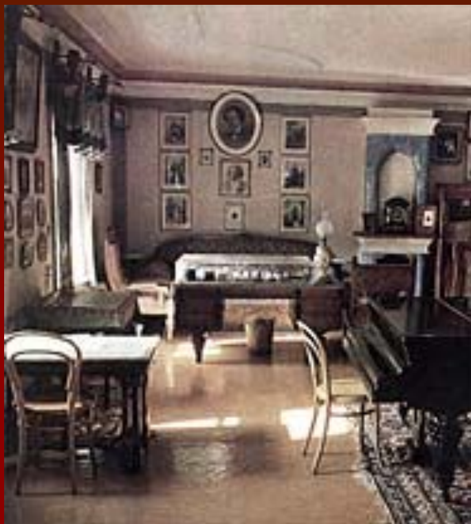
Кабинет-гостиная дома-музея П. И. Чайковского в Клину.