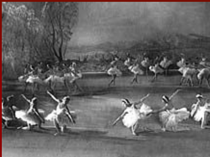
Сцена из балета П. И. Чайковского «Лебединое озеро».

Последний период жизни композитора отмечен всемирным признанием творчества Чайковского, проявившимся не только в восторженном приеме его сочинений (в 1891 он с триумфом гастролировал в США; в 1892 — в Гамбурге под управлением Г. Малера с огромным успехом прошел «Евгений Онегин»), но и в избрании композитора членом-корреспондентом парижской Академии изящных искусств (1892) и почетным доктором Кембриджского университета (1893).