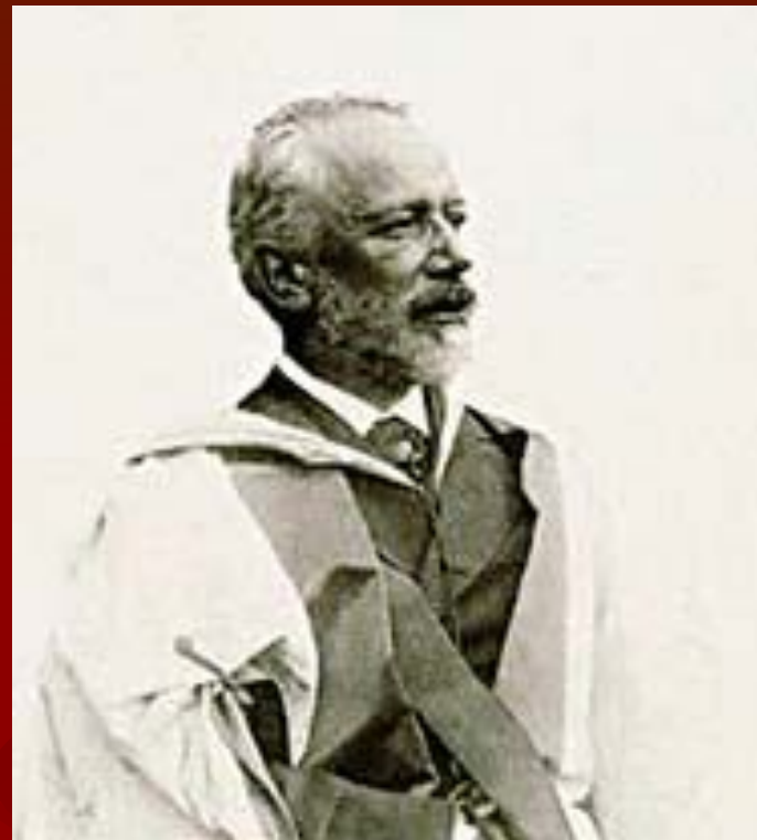
Петр Ильич Чайковский в Кембридже. 1893 год.

Смерть настигла Чайковского в расцвете творческих сил и славы: композитор заразился холерой через несколько дней после того, как дирижировал на премьере Шестой симфонии в Петербурге (преьера — 16 октября, начало болезни — 21 октября); смерть наступила спустя 4 дня.