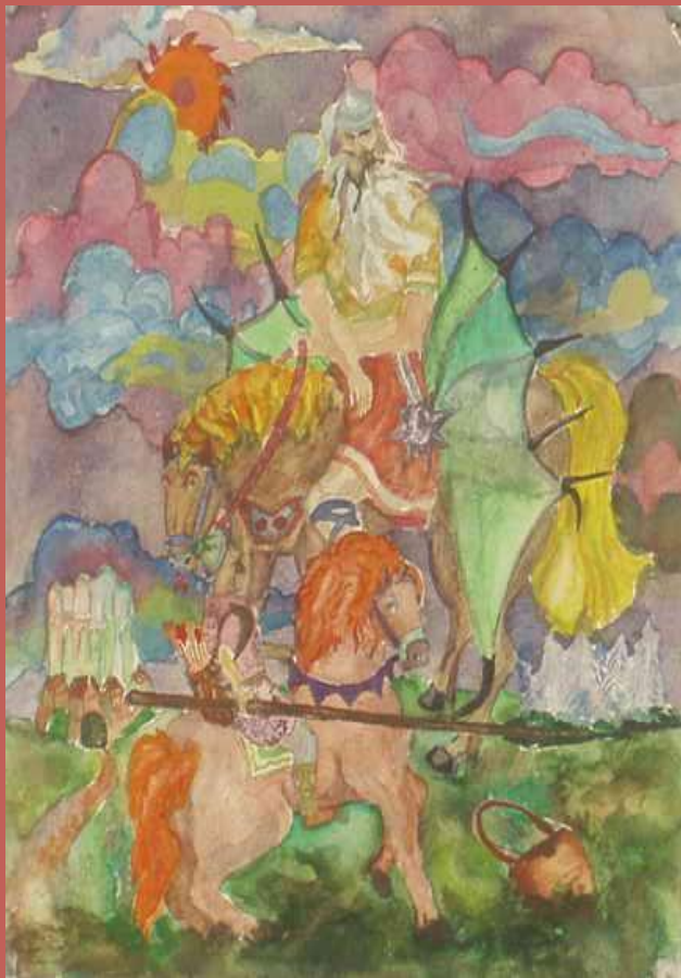
Илья Муромец и Святогор

Как припев в песне, повторяются и в былине стихи. Так в былине «Илья Муромец и Калин-царь» читаем: