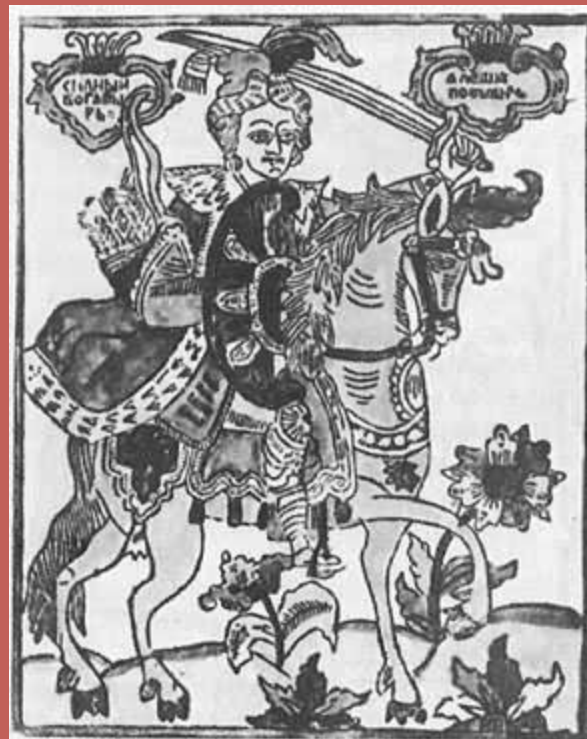
Богатырь Алеша Попович. Лубочная картинка. Север. Конец XVII века

А тут той старинке и славу поют, А по твоих мест старинка и покончилась.