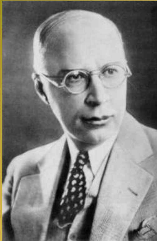
С. С. Прокофьев