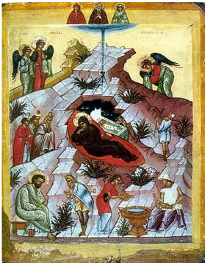
Икона Рождество Христово