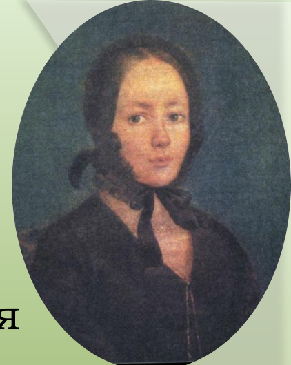
А. П. Керн