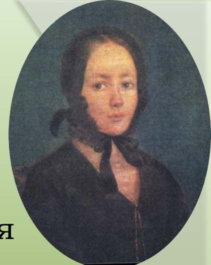
А. П. Керн