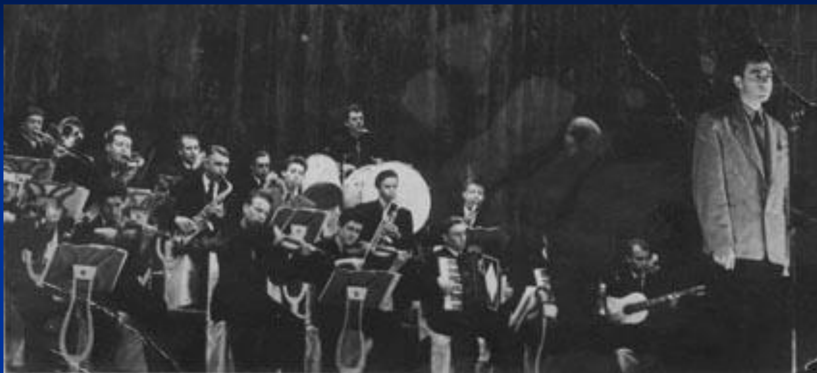
Джаз-оркестр п/у Р.Идельчика. Май 1957г.