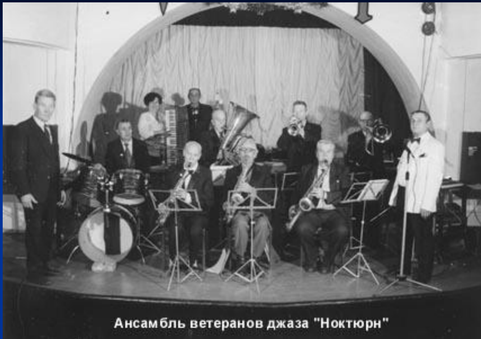
Ансамбль ветеранов джаза "Ноктюрн"