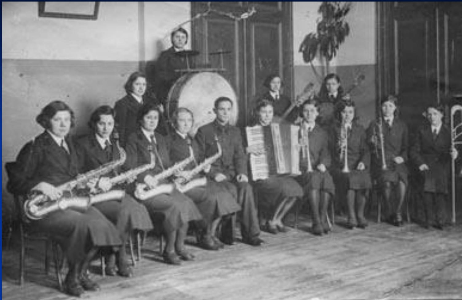
Единственный в Самаре женский джаз-оркестр. 1940г.