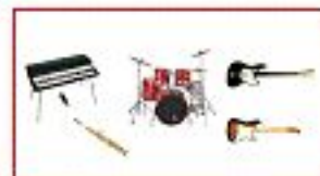
Джаз-рок фьюжн бэнд