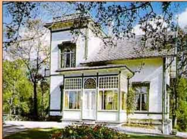
Дом, в котором жил Эдвард Григ