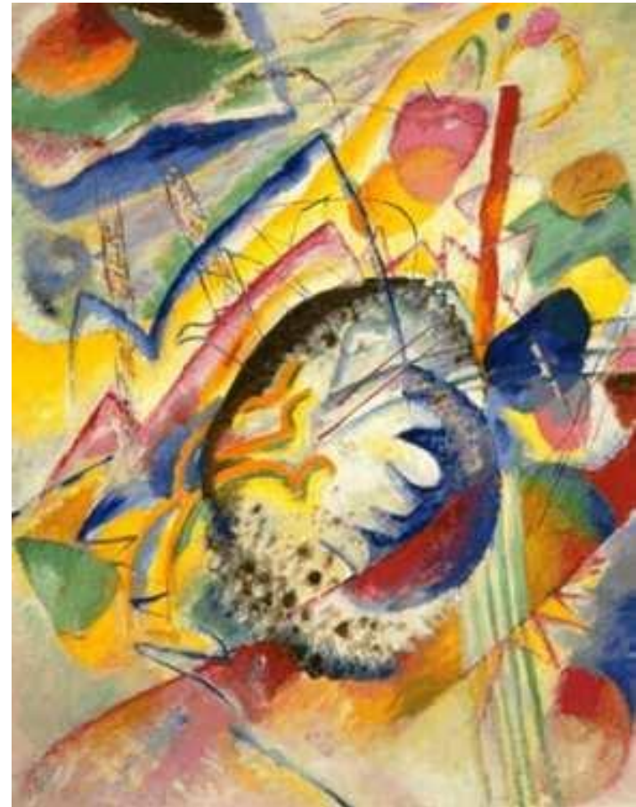
Василий Кандинский, "Композиция"