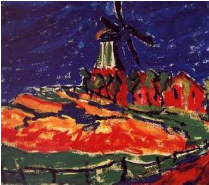
Эрих Хеккель. "Мельница"