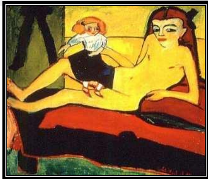
ЭРИХ ХЕККЕЛЬ. ДЕВОЧКА С КУКЛОЙ

В картинах выражено предчувствие какого-то ужаса через деформацию предметов, природных форм, как бы разрушается и дискредитируется все, что казалось незыблемым. Художники обращаются к литературным темам, иллюстрируют романы Ф.М. Достоевского. ( Э.Хеккель "Двое мужчин за столом", 1912г. Литературная подоснова: "Идиот", сцена первого визита князя Мышкина в дом Рогожина.)