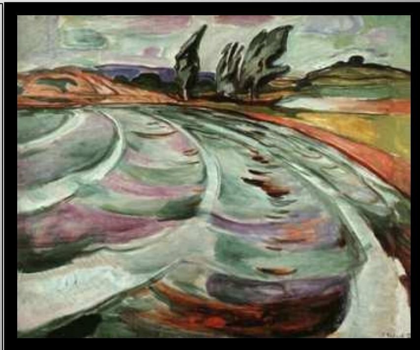
Эдвард Мунк, "Волна"

Художники-экспрессионисты имели большое значение на рубеже XIX-XX вв. в западноевропейской культуре. Экспрессионизм возникает как протест на ужасы войны и подавленности личности социальным механизмом. Течение экспрессионизма было широко развито в Западной Европе, что подтверждается великими представителями этого течения в разных странах.