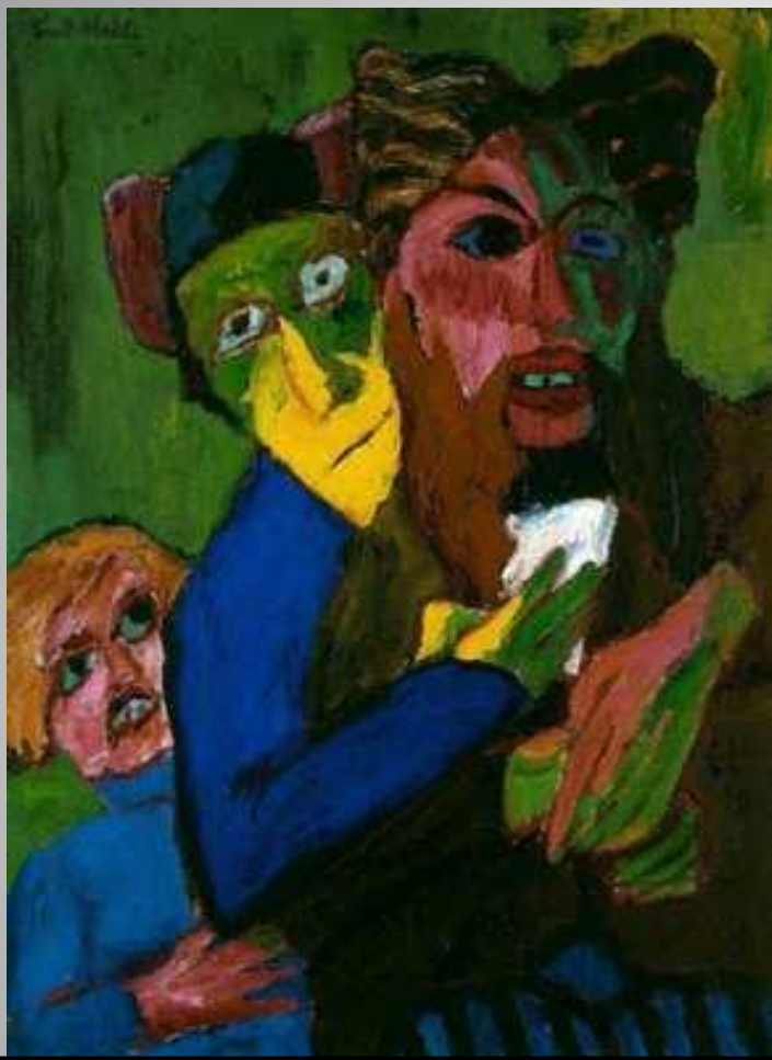
Эмиль Нольде. "Возбужденные люди".