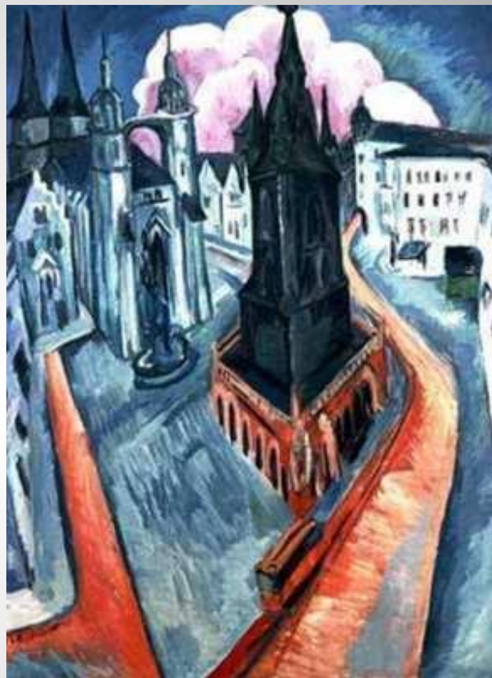
Эрнст Кирхнер. «Красная башня в галле»