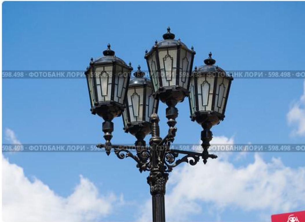
Фонарь на улице Вайнера, Екатеринбург