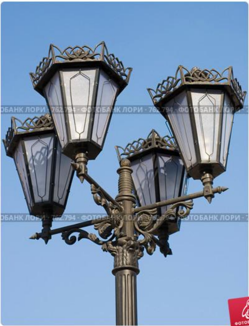
Фонарь в Историческом сквере. Екатеринбург