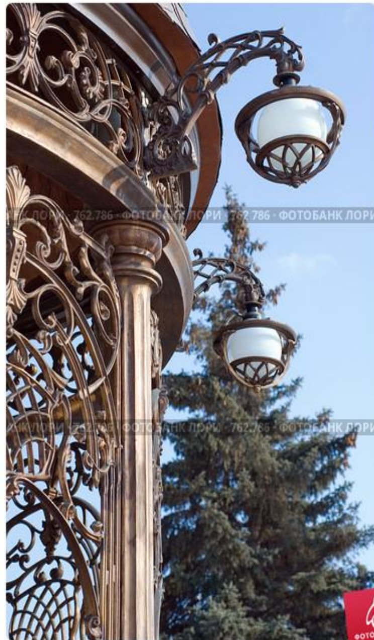
Фонари на летней беседке