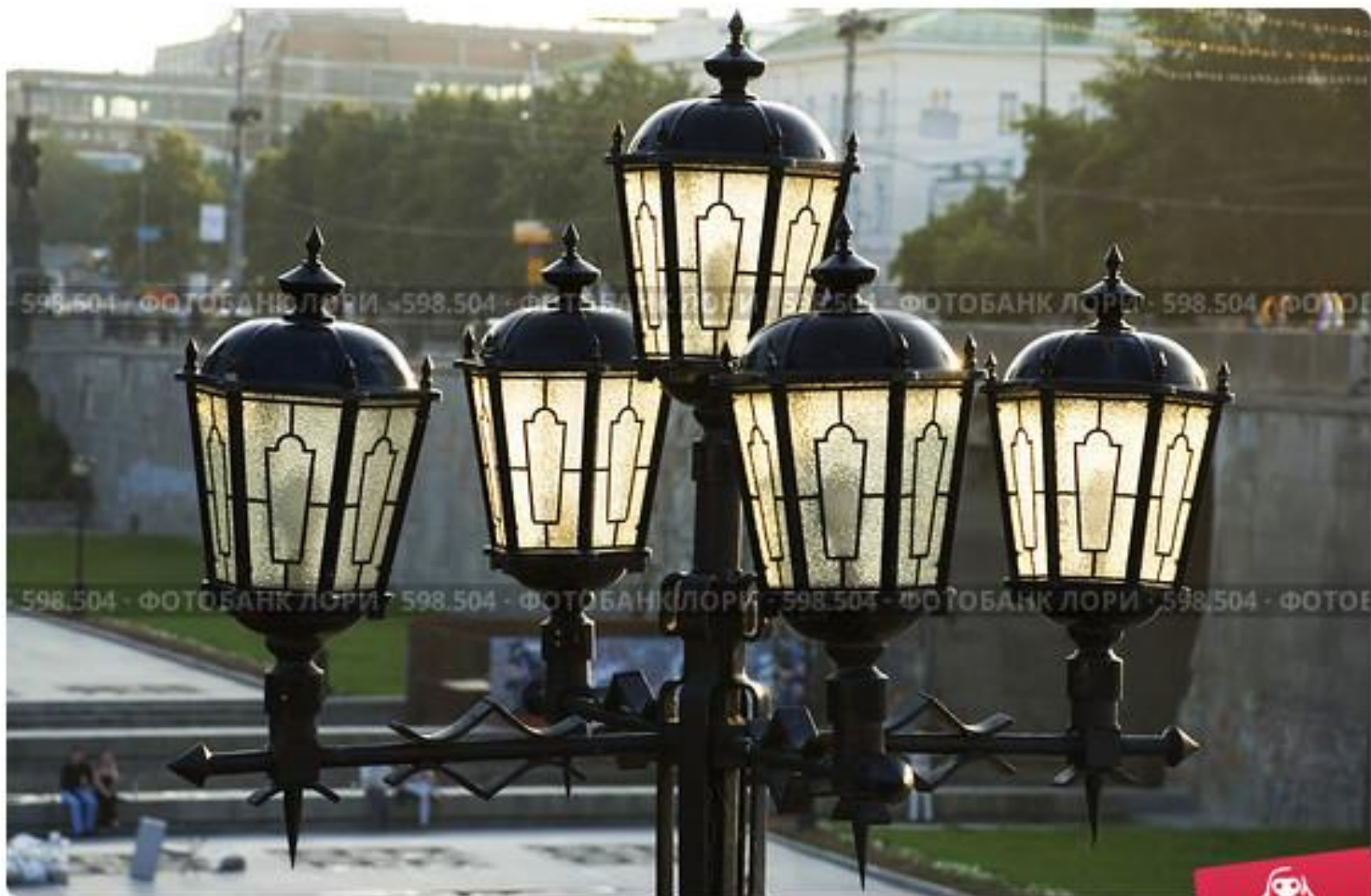
Фонарь в историческом сквере. Екатеринбург.