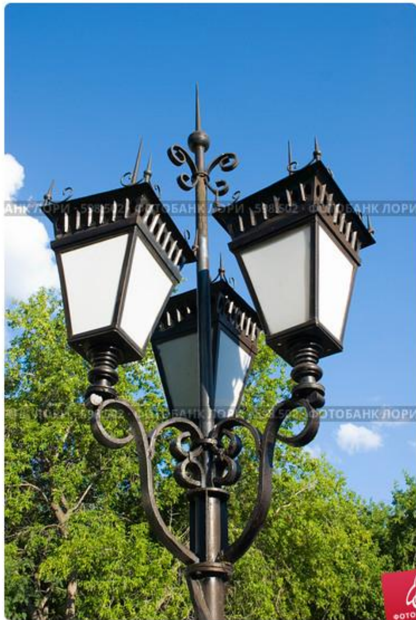
Фонарь в литературном квартале. Екатеринбург.