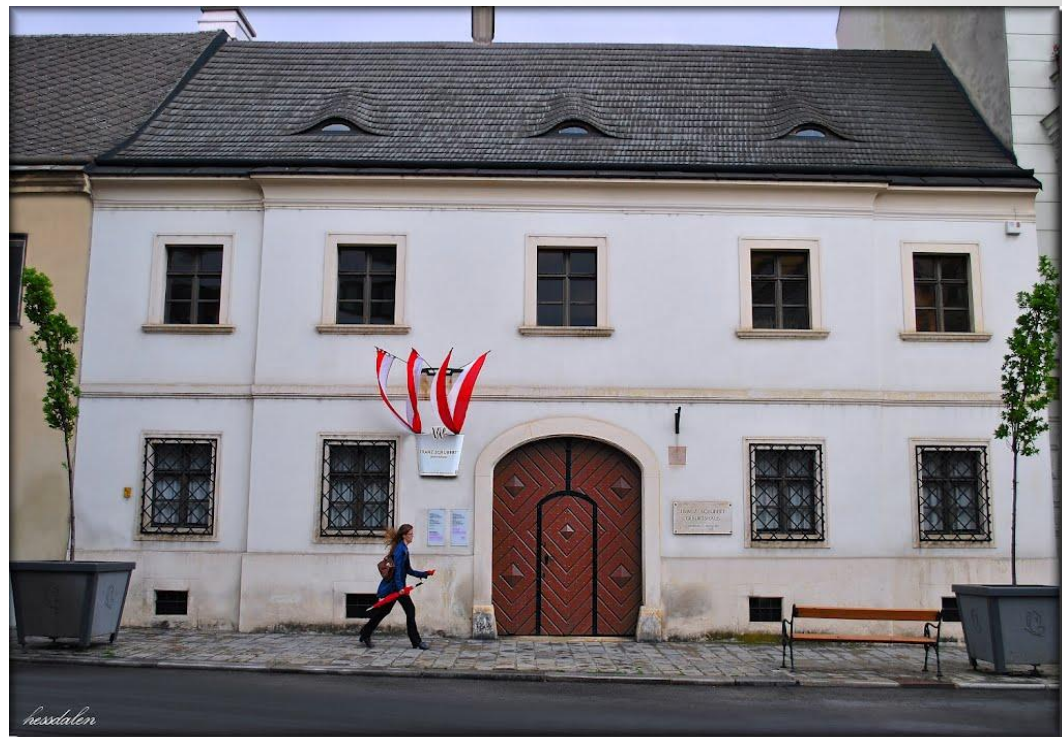
Дом где родился Ф.Шуберт