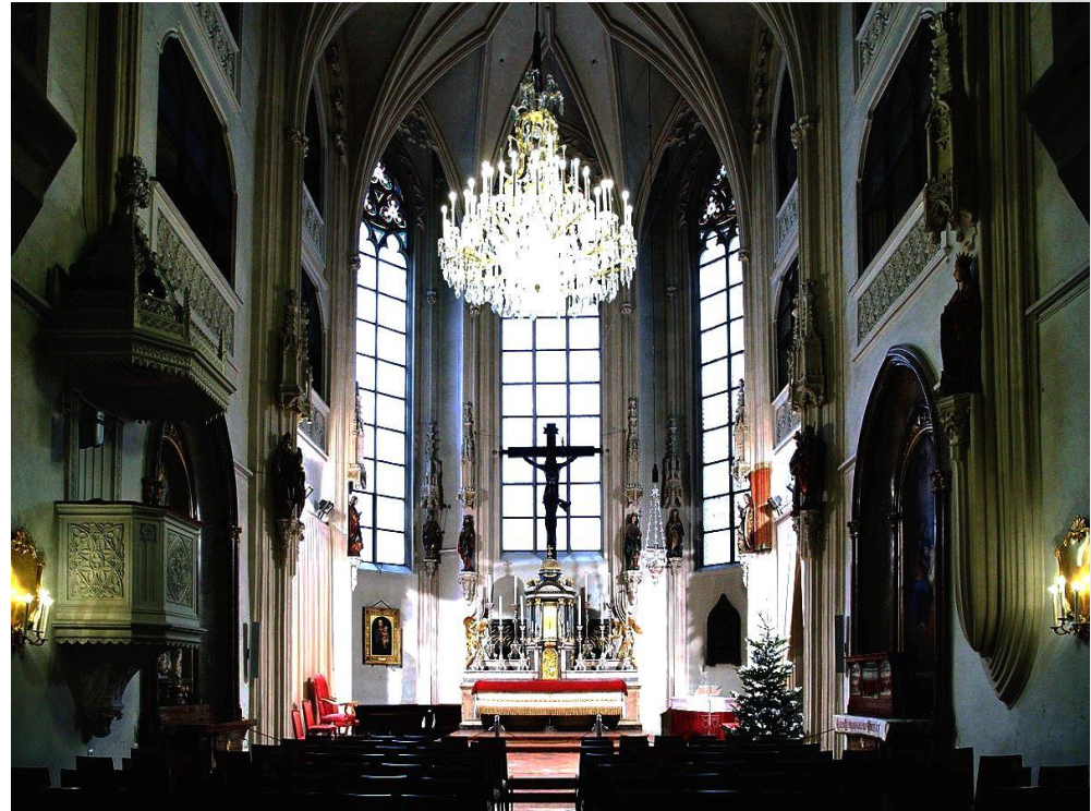
Венская придворная капелла.