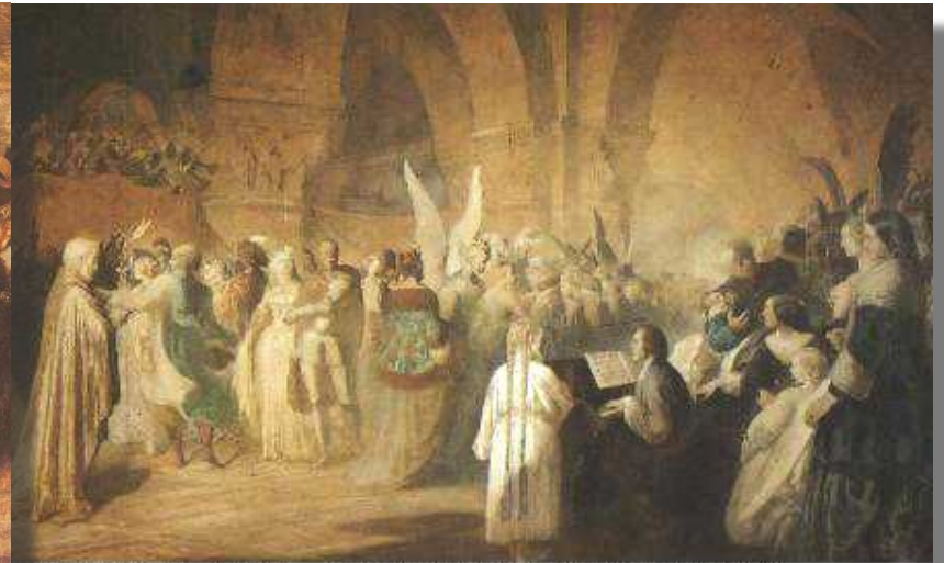
Г. Квятковский. Полонез Шопена - бал в отеле "Ламбер", 1849-1860