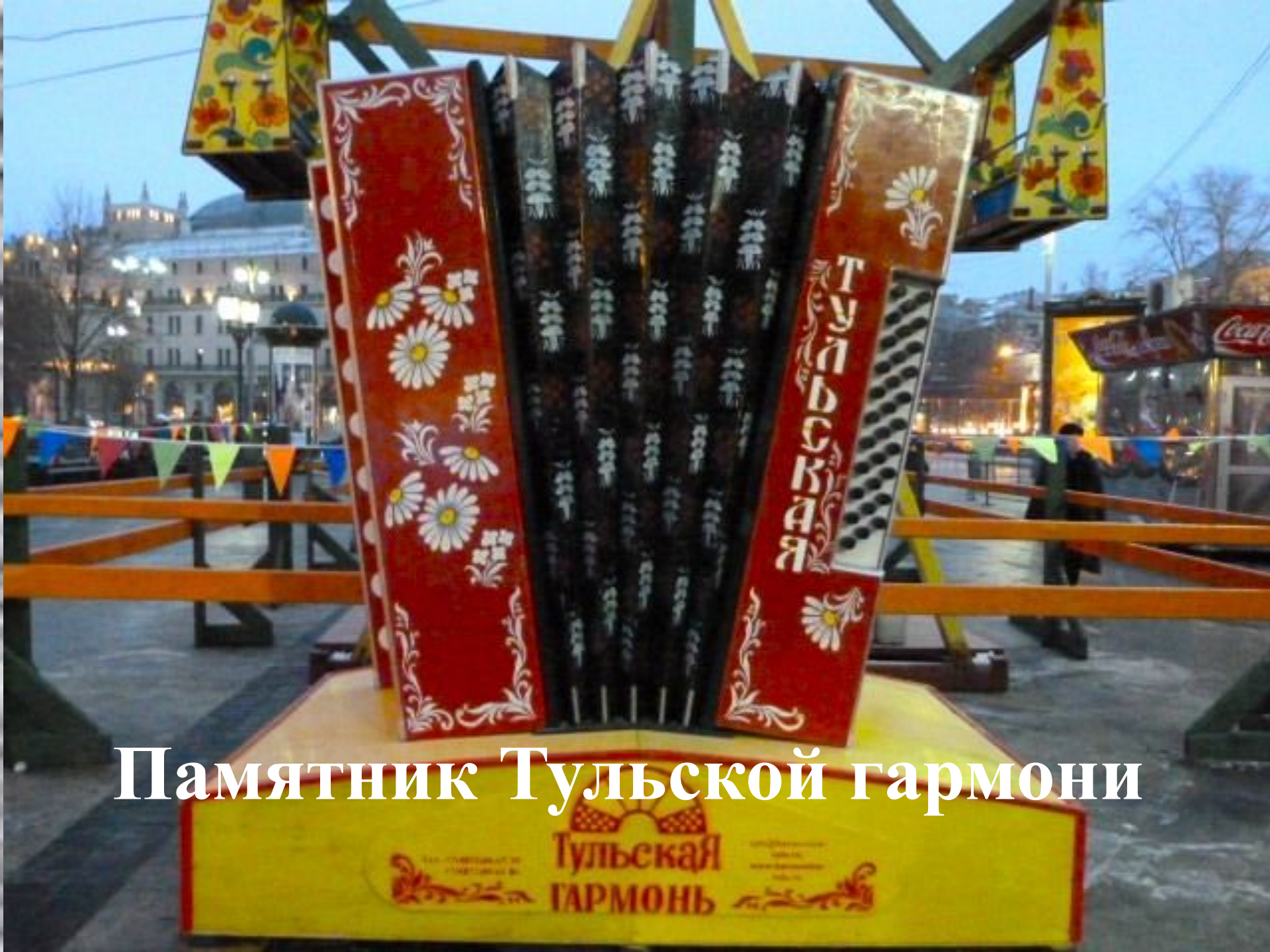
Памятник Тульской гармонии