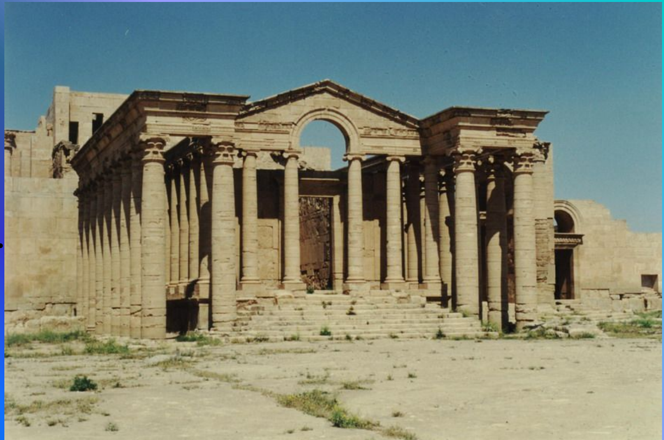
Храм Гармонии. Хатра (Ирак).

Гармония – красота, соразмерность: в архитектуре, состоянии души, человеческой фигуре.