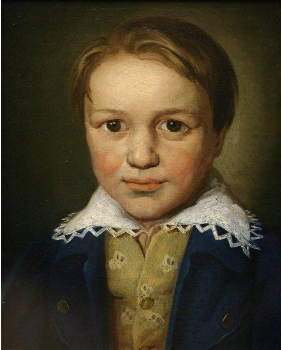
Людвиг ван Бетховен