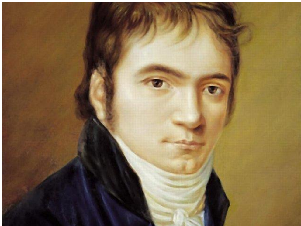
Людвиг ван Бетховен