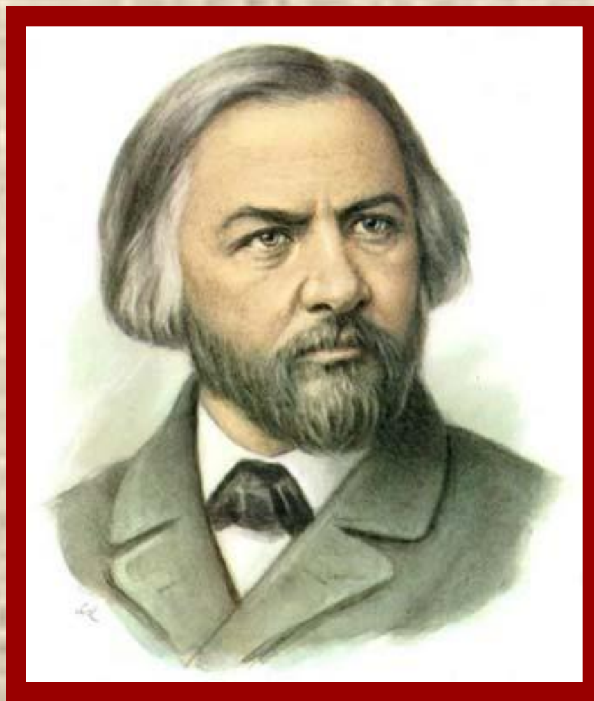
М.И.Глинка 1804 - 1857