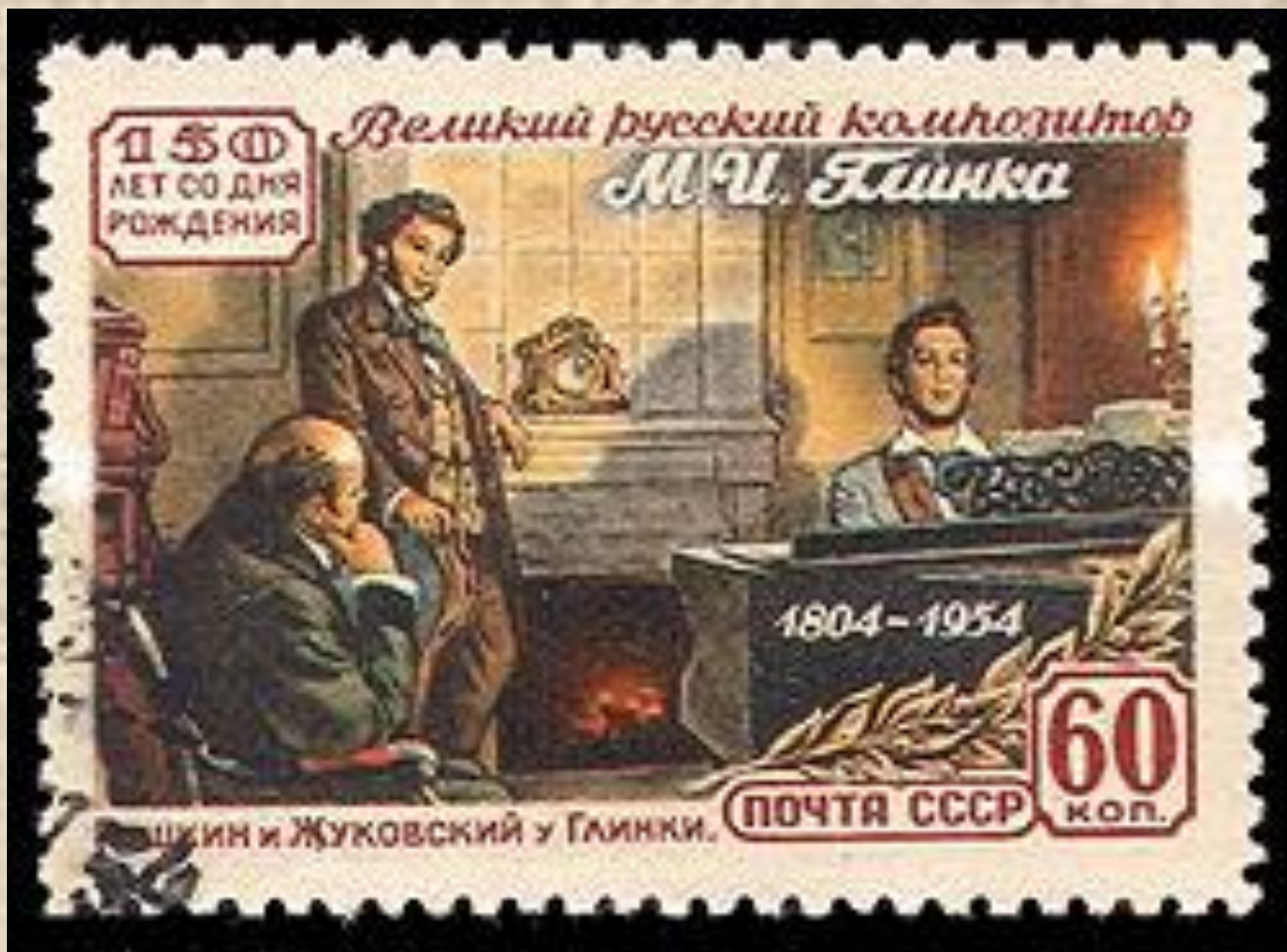
В.А.Жуковский, А.С.Пушкин, М.И.глинка