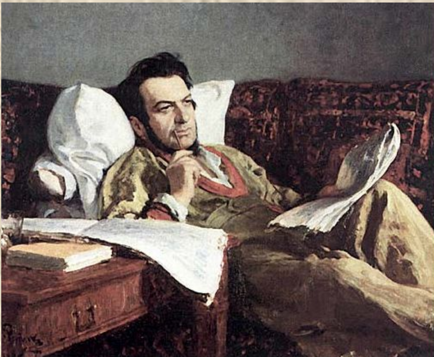
Глинка сочиняет оперу «Руслан и Людмила»