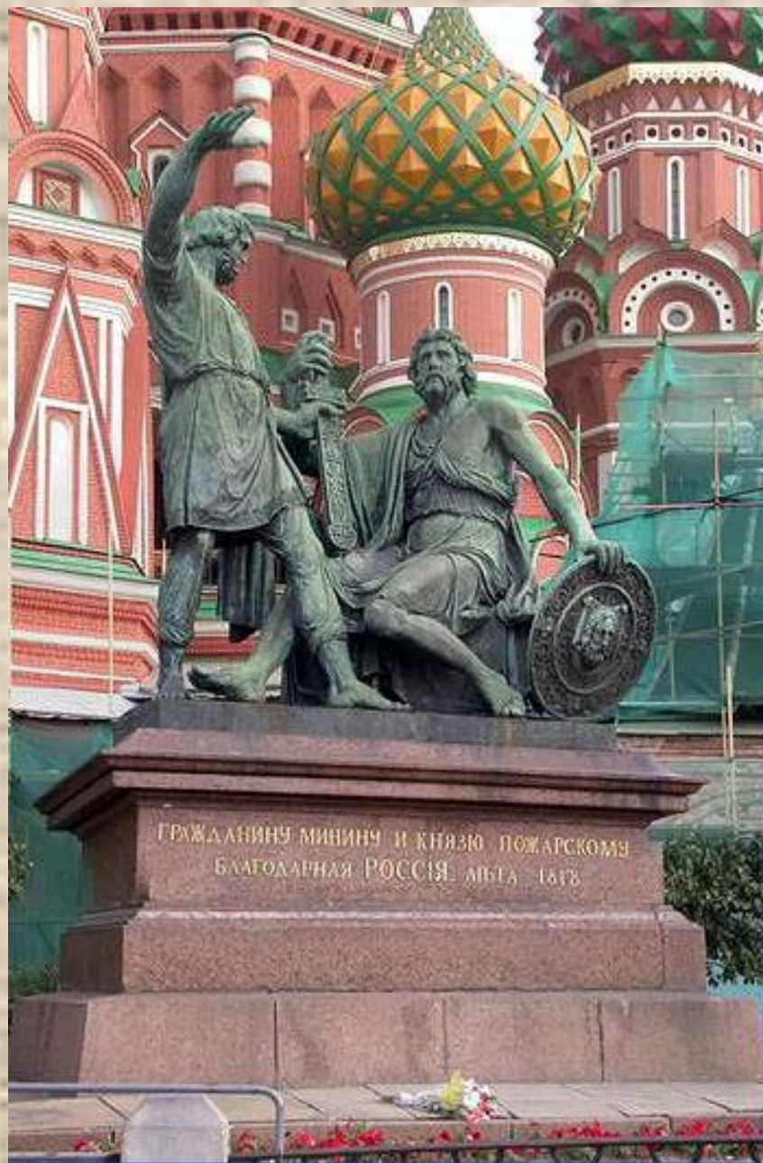
Памятник Минину и Пожарскому в Москве