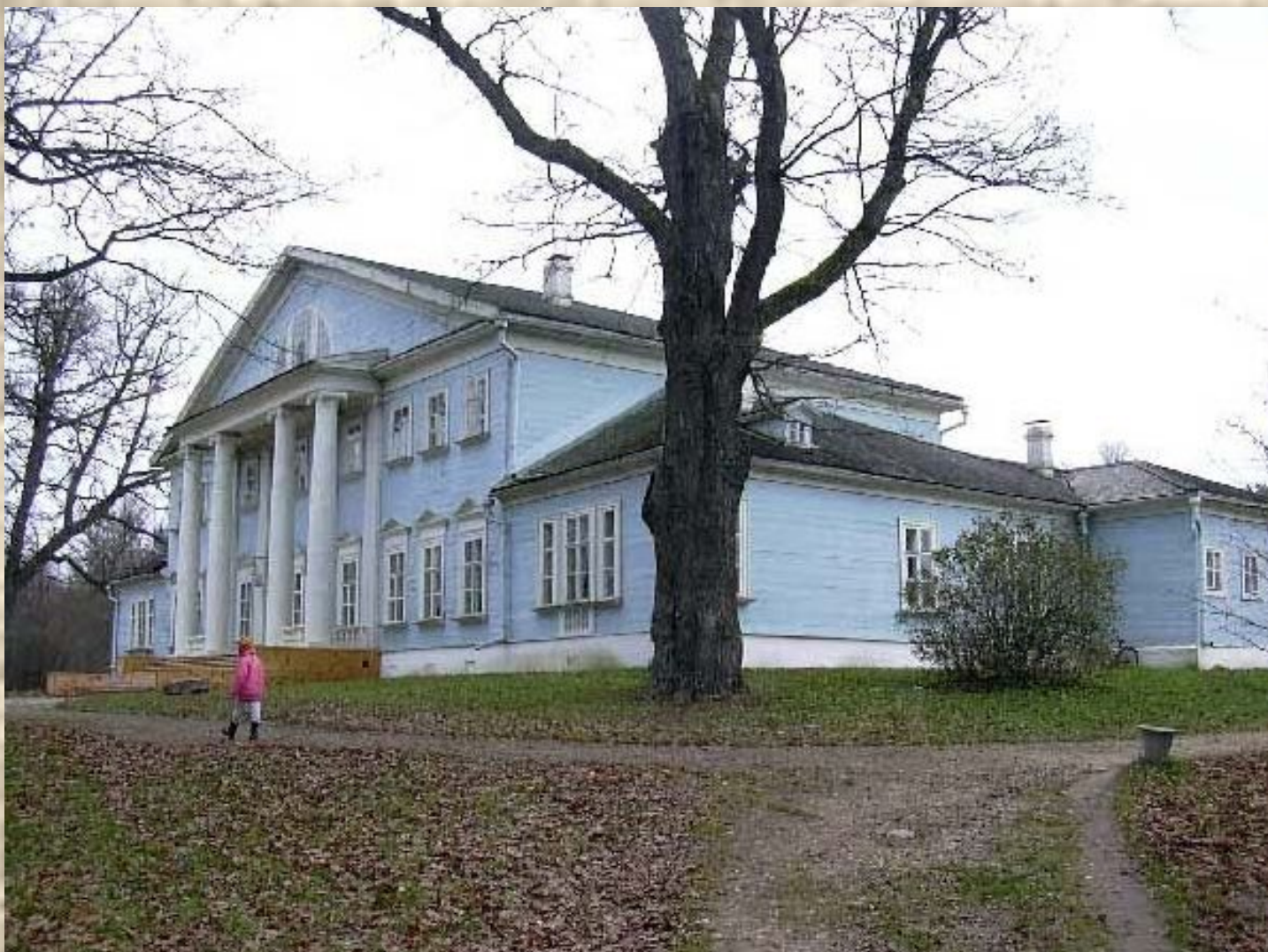
Дом в котором прошло детство М.И.Глинки (село Новоспасское)