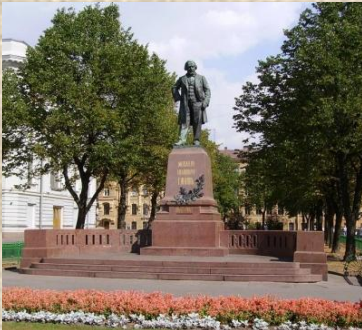
памятник М.И.Глинке в Петербурге