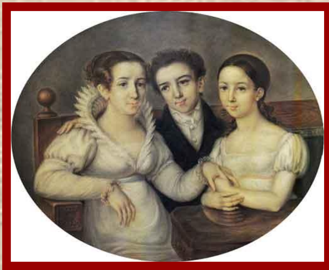
М.И.Глинка с матерью и сестрой