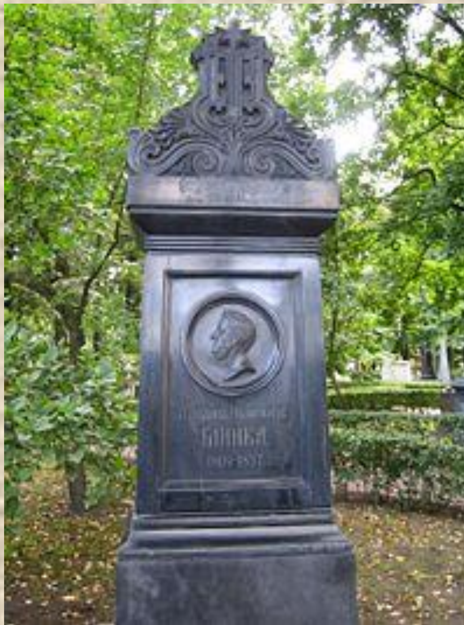
могила М.И.Глинки на Тихвинском кладбище в Петербурге