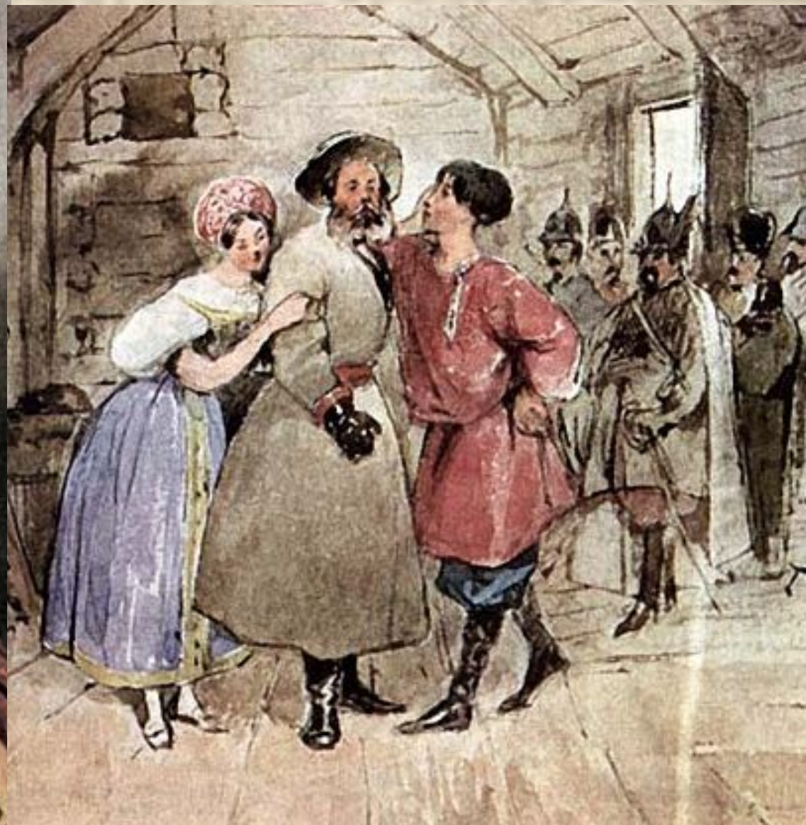
Сцены из оперы «Иван Сусанин» 1836г.