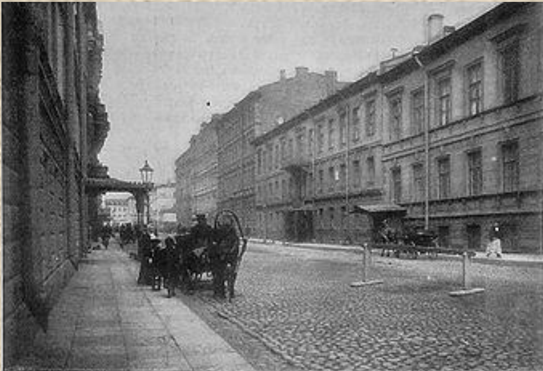
Дом в Петербурге где жил Глинка с 1854-1856г.