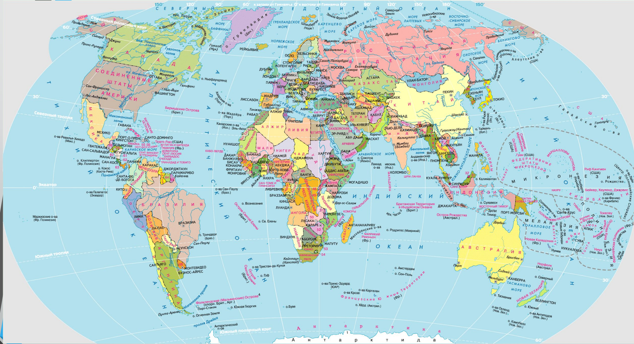
ЦИФРАМИ НА КАРТЕ ОБОЗНАЧЕНЫ ГОСУДАРСТВА И ТЕРРИТОРИИ