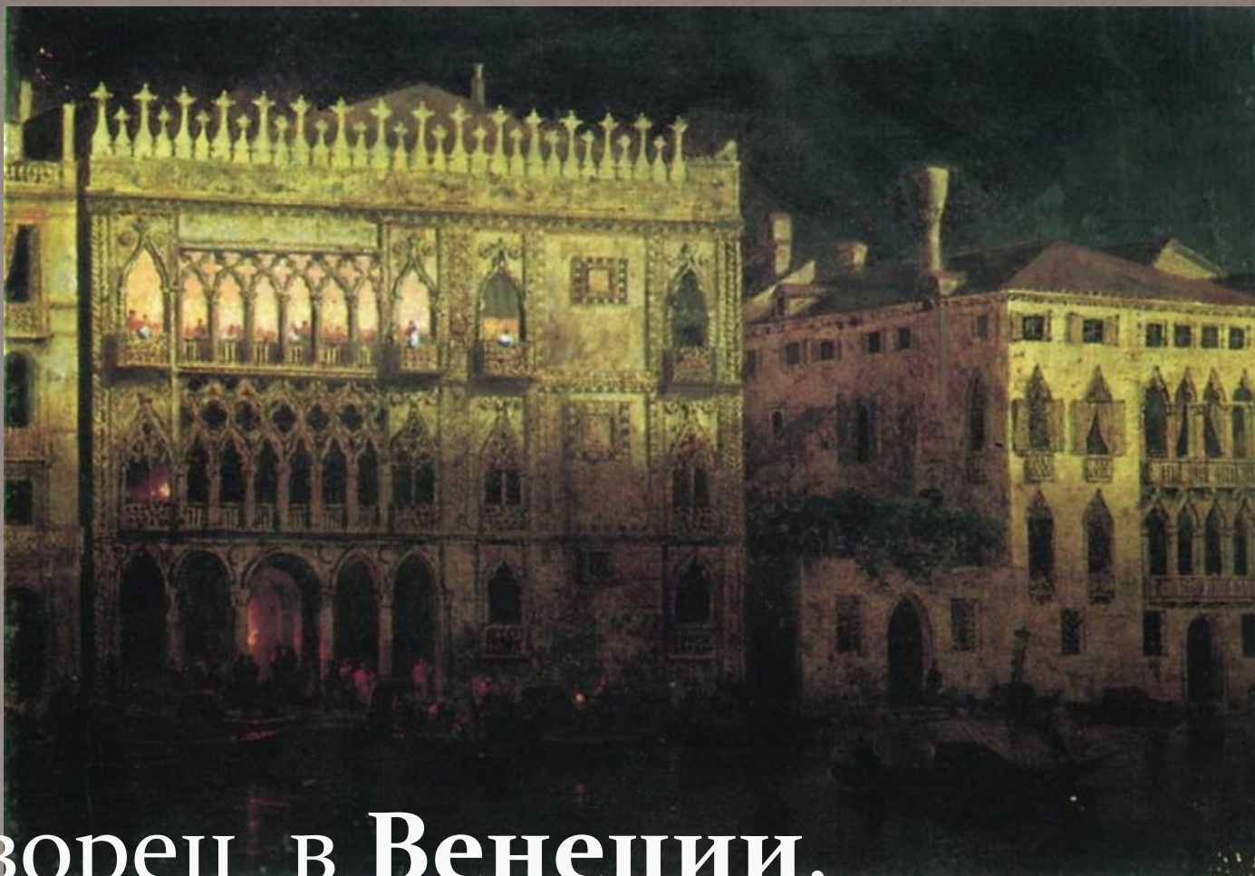
Дворец в Венеции, Айвазовский