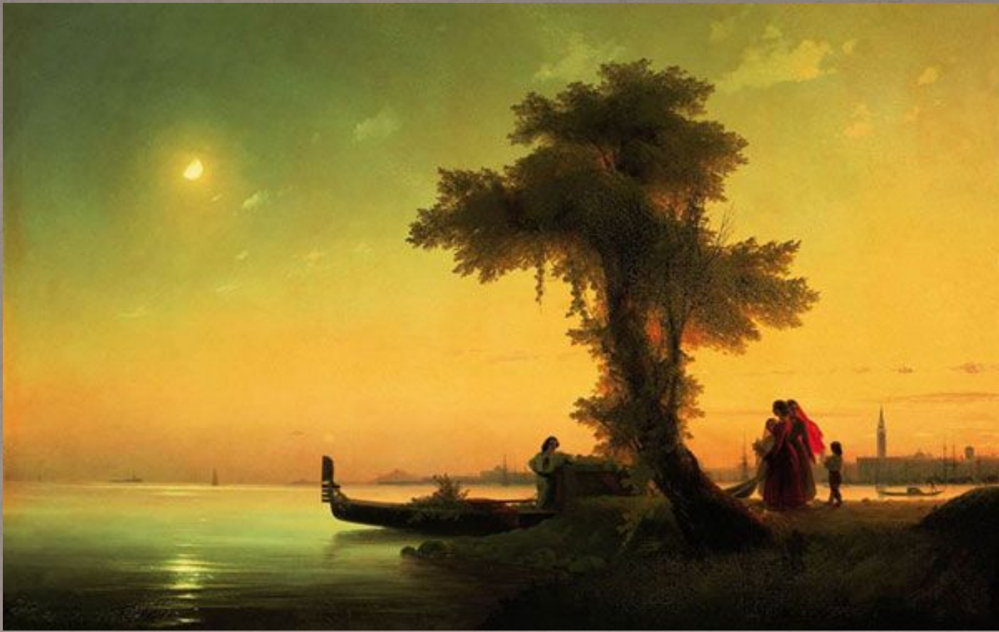
Айвазовский «Венецианская лагуна»