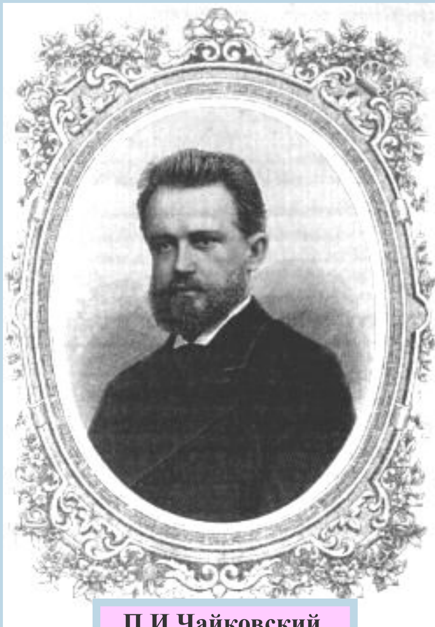
П.И.Чайковский. Фотография 1860 г.

Величайший вклад в сокровищницу мирового музыкального искусства внес П.И.Чайковский. Его оперы «Евгений Онегин», «Пиковая дама», балеты «Лебединое озеро», «Спящая красавица» и др. составляют гордость репертуара крупнейших театров во всем мире.