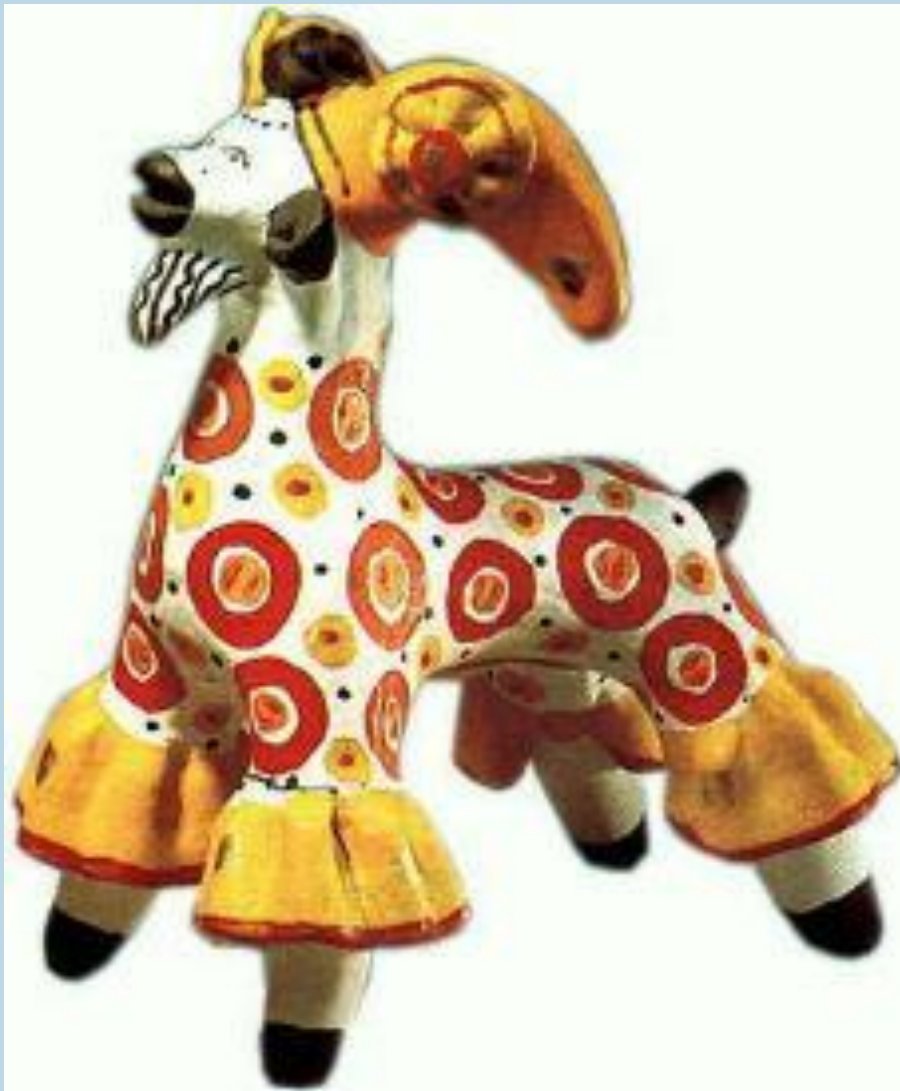
Цирковой козел. Дымковская игрушка.

В селе Дымково близ Вятки изготавливали глиняные игрушки-свистульки в виде людей, животных, птиц. Их раскрашивали яркими анилиновыми красками. Характерной чертой дымковской игрушки стали пышные воротники, оборки, яркий геометрический орнамент.