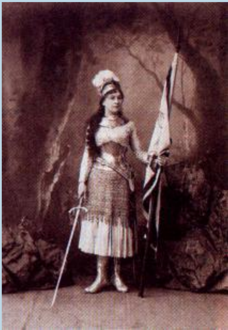
М.Н.Ермолова в роли Жанны д'Арк.

Ведущее место в развитии русского театра сыграл Малый театр. Специально для него писал пьесы, а затем ставил их А.Островский. В Петербурге блистал Мариинский театр. 2я пол.19 века дала целую плеяду выдающихся актеров, появились актерские династии- Садовские, Самойловы, Васильевы. «Звездой» русского театра стала М. Н.Ермолова—прима Малого театра.