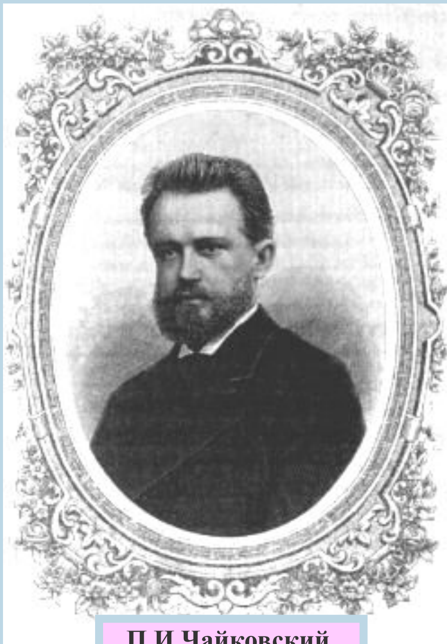
П.И.Чайковский. Фотография 1860 г.

Величайший вклад в сокровищницу мирового музыкального искусства внес П.И.Чайковский. Его оперы «Евгений Онегин», «Пиковая дама», балеты «Лебединое озеро», «Спящая красавица» и др. составляют гордость репертуара крупнейших театров во всем мире.