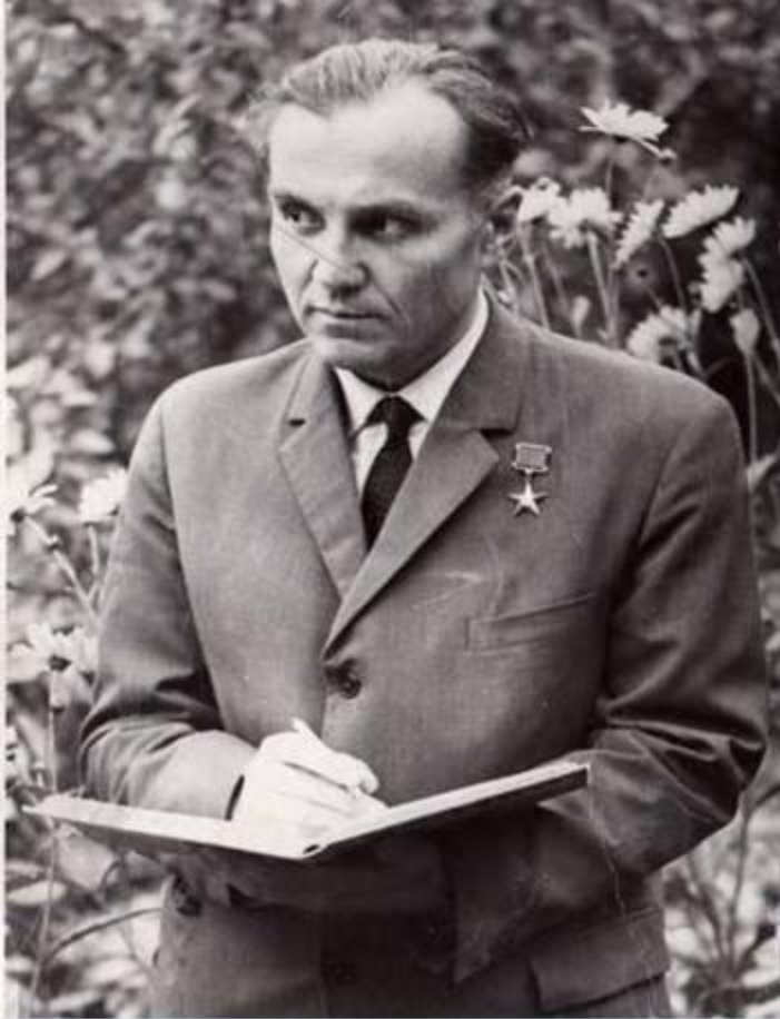
Василий Александрович Сухомлинский