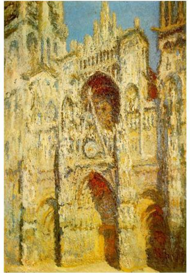
К.Моне «Руанский собор»