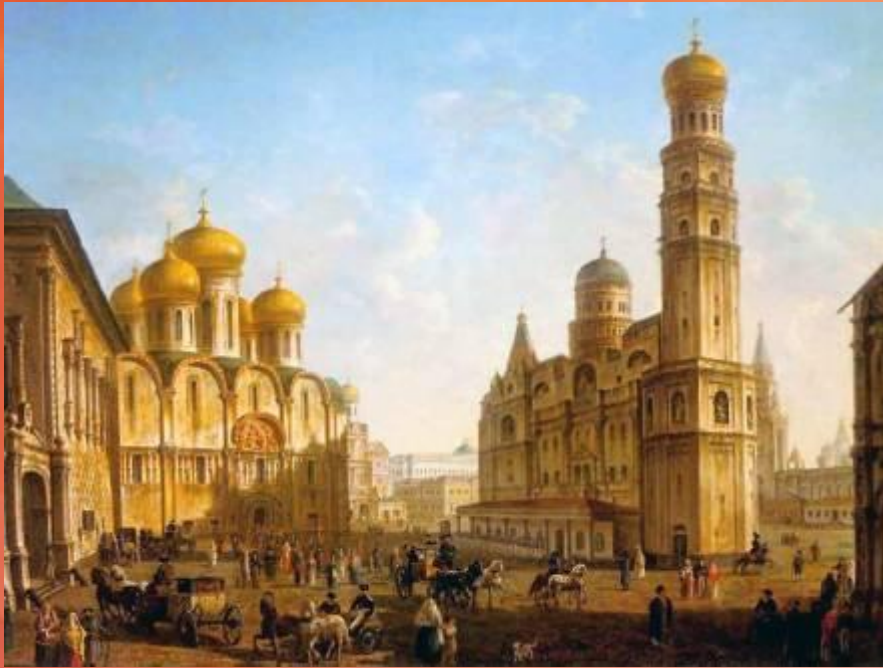
Ф.Я.Алексеев «Соборная площадь в Москве»