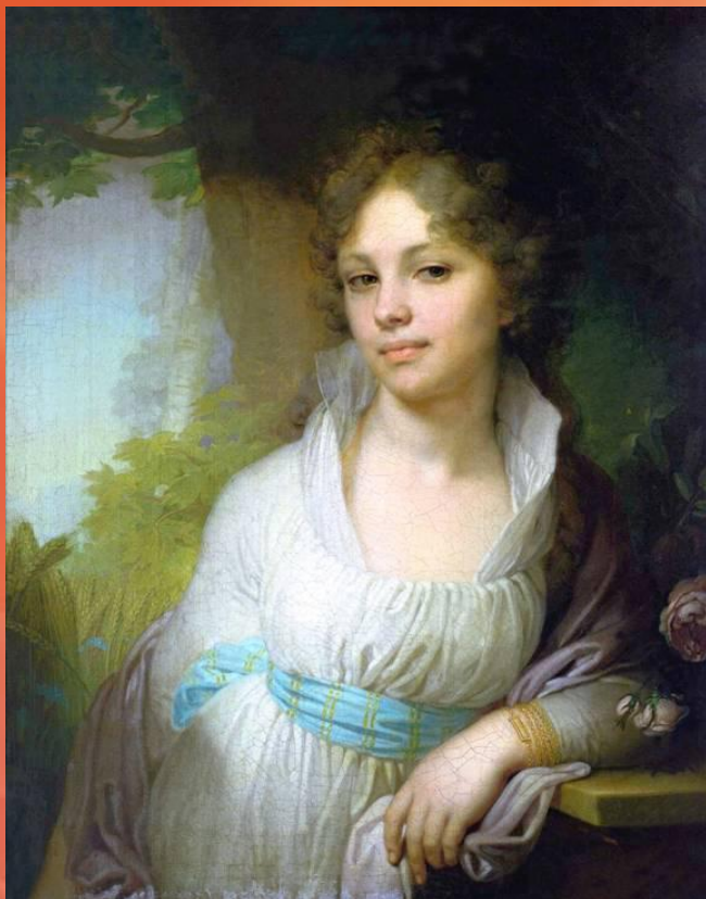
Вл.Боровиковский Портрет графини Лопухиной