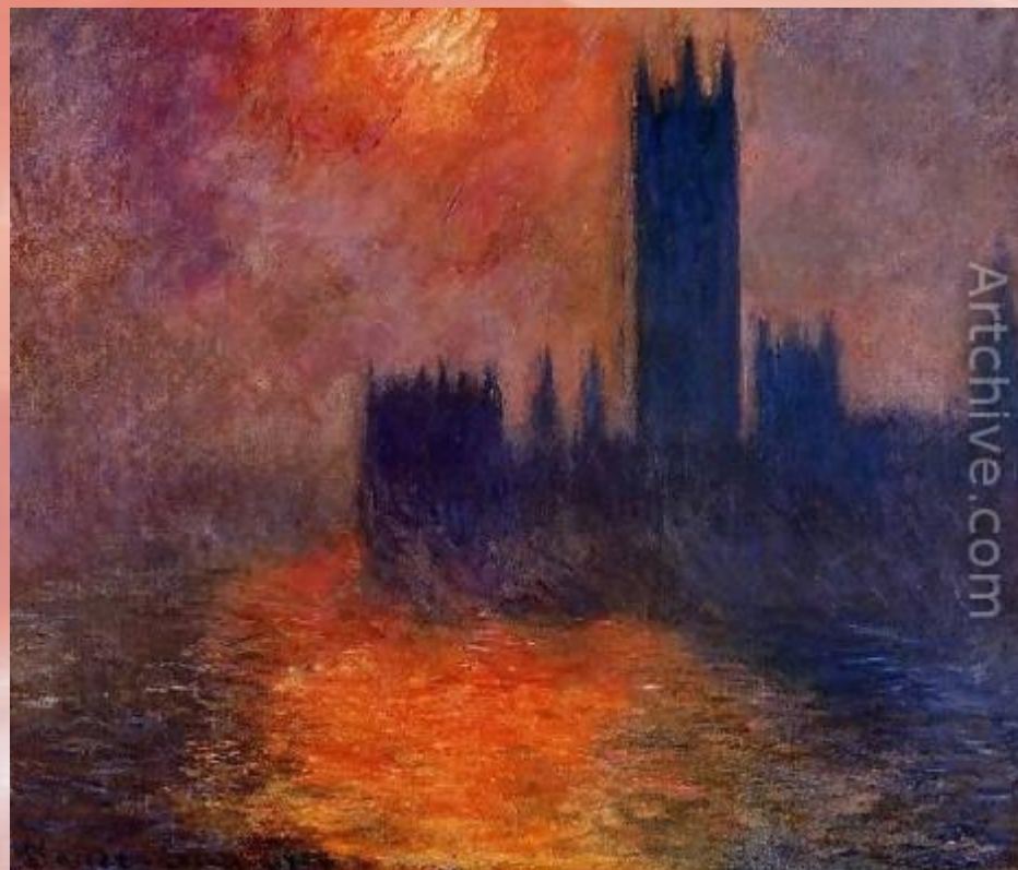
Лондонский парламент «Солнце, пробивающееся сквозь туман»