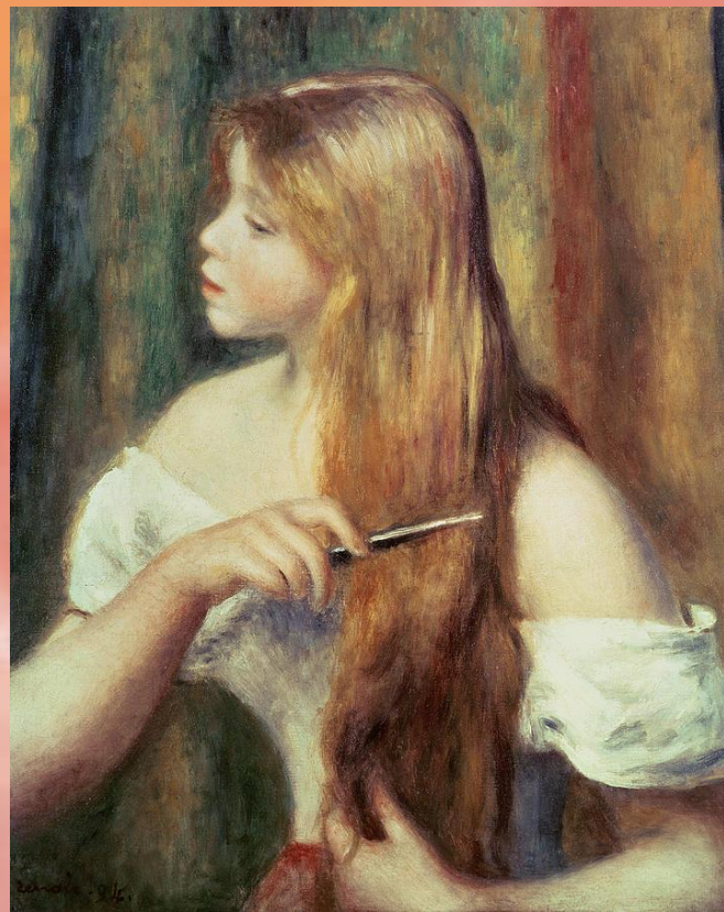
О.Ренуар Юная девушка, Расчесывающая волосы