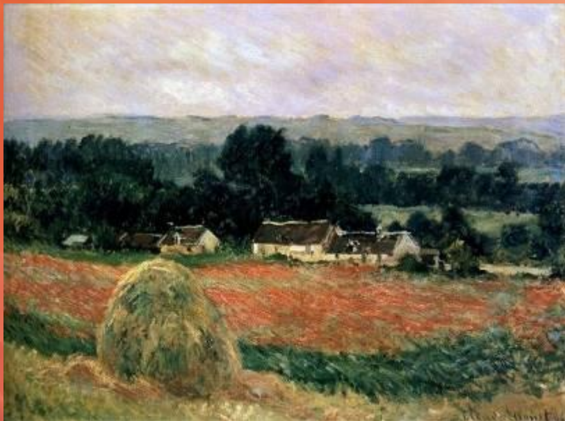
Стога в Живерни