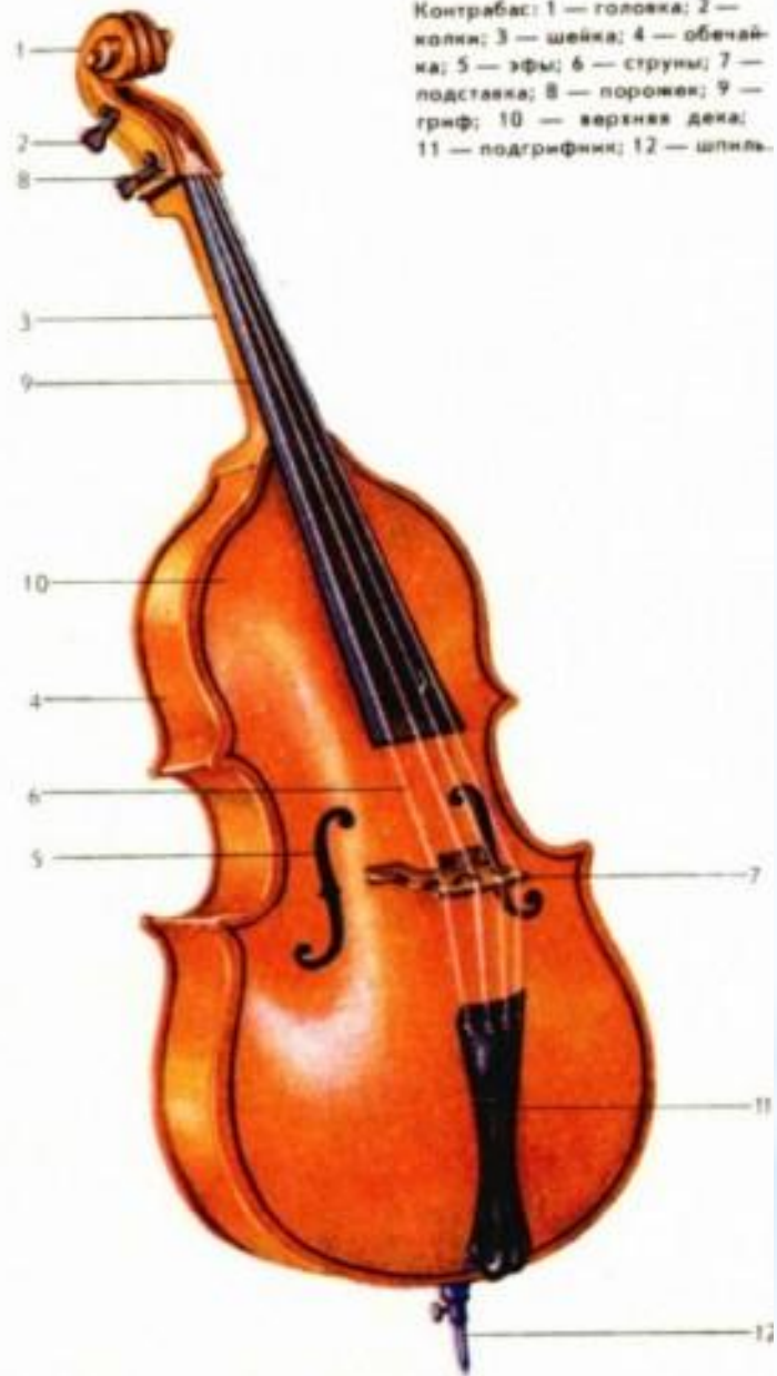
Контрабас: 1 — головка; 2 — колки; 3 — шейка; 4 — обечай- ка; 5 — эфы; 6 — струны; 7 — подставка; 8 — порожек; 9 — гриф; 10 — верхняя дека; 11 — подгрифник; 12 — шпиль.