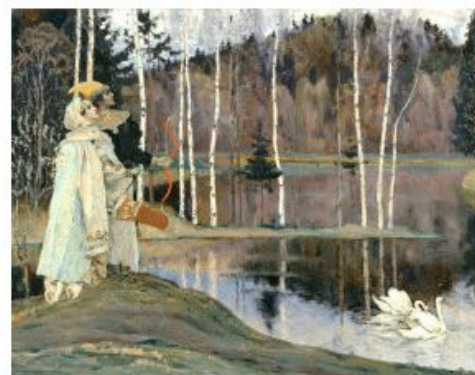
Н.Нестеров. «Два лада».