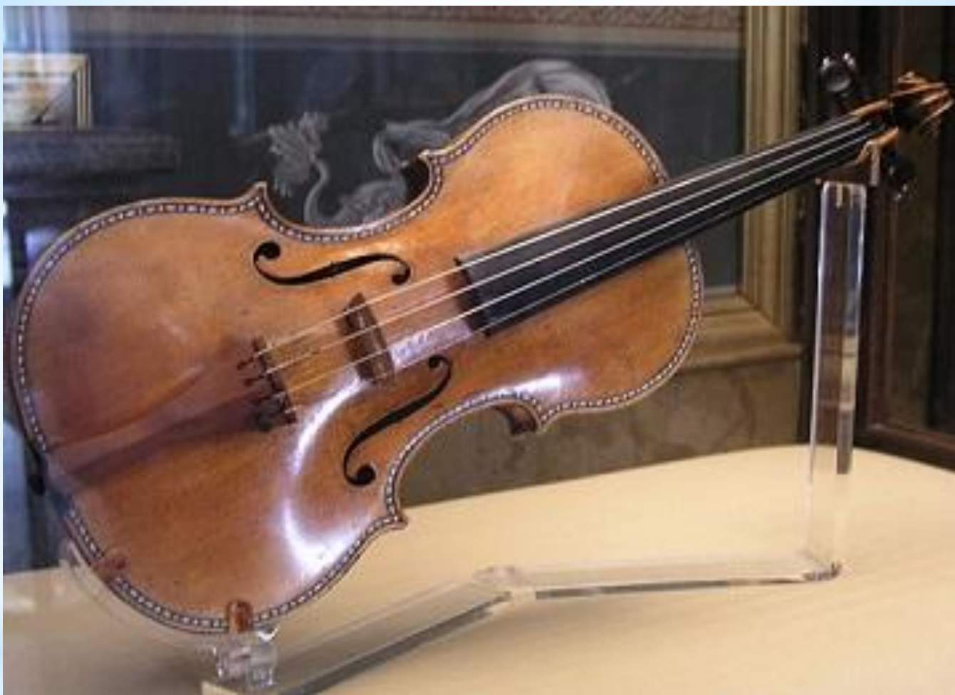
Скрипка Антонио Страдивари