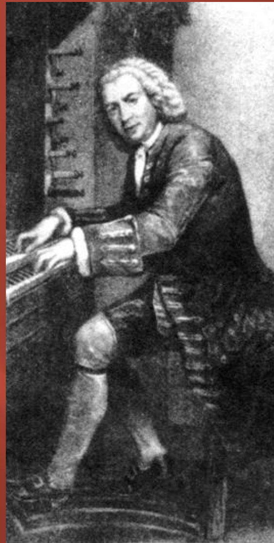
Иоганн Себастьян Бах