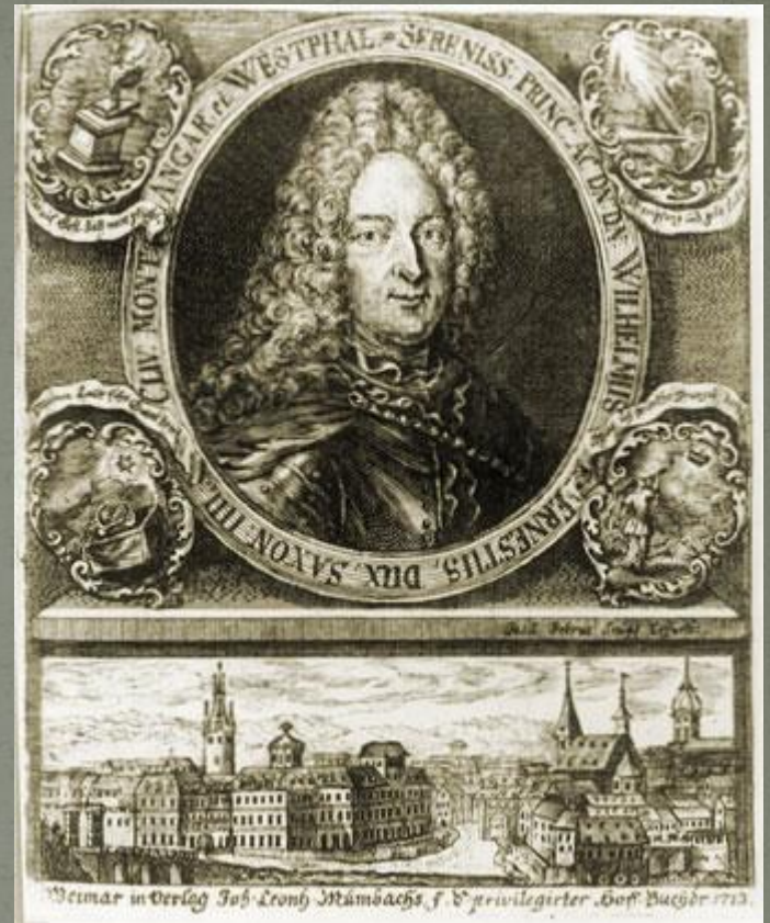
Вильгельм Эрнст Саксен-Веймарский

Следующие 9 лет стали для уже известного в определенных кругах музыканта временем интенсивной и насыщенной работы. Бах служит придворным музыкантом у герцога Веймарского, много пишет и доводит уже написанные произведения до совершенства.