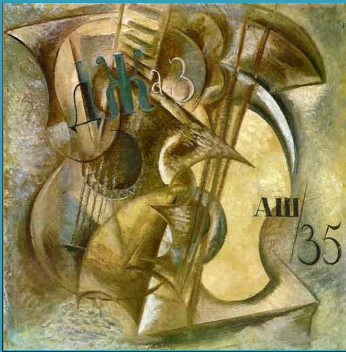
А. Шевченко «Джаз»