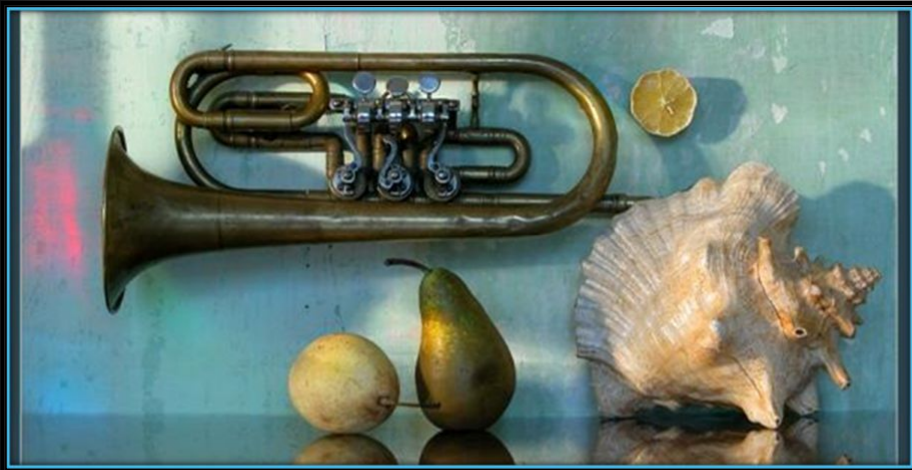
С. Белов «Утренний блюз»