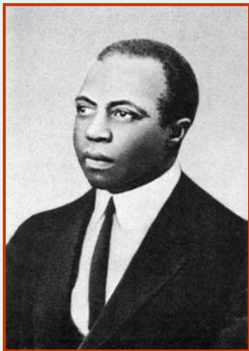
Скотт Джоуплин (1868 – 1917)