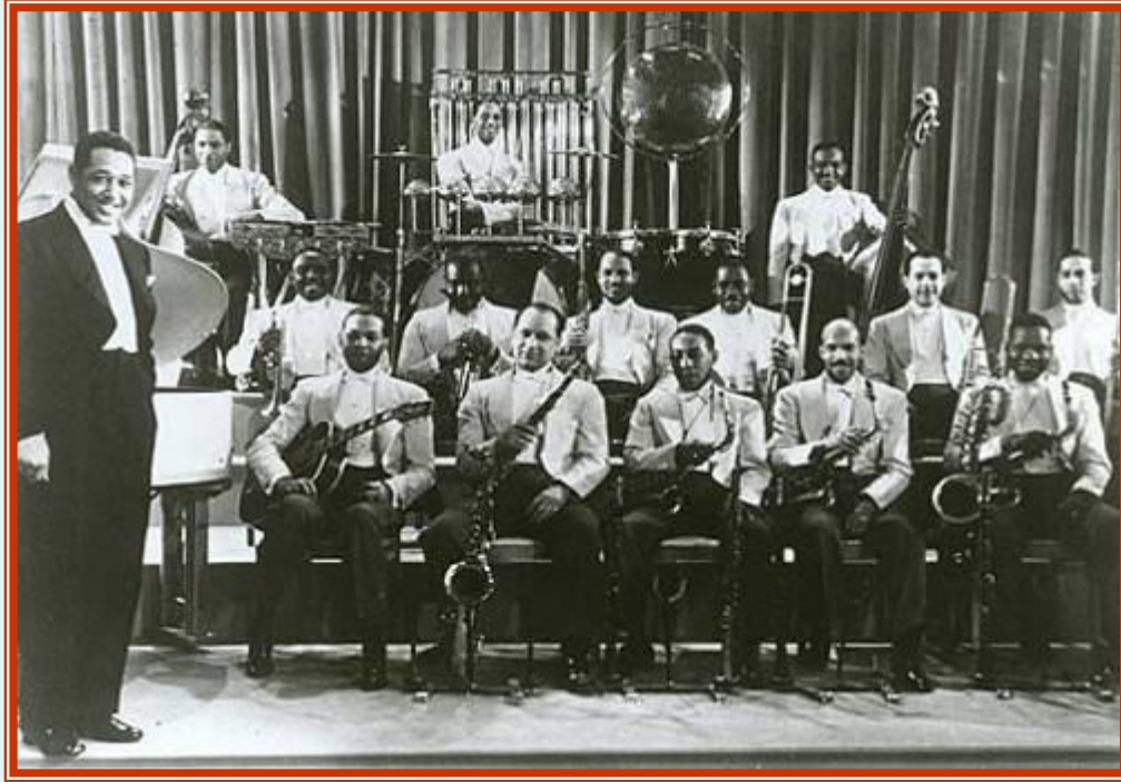
Оркестр Дюка Эллингтона