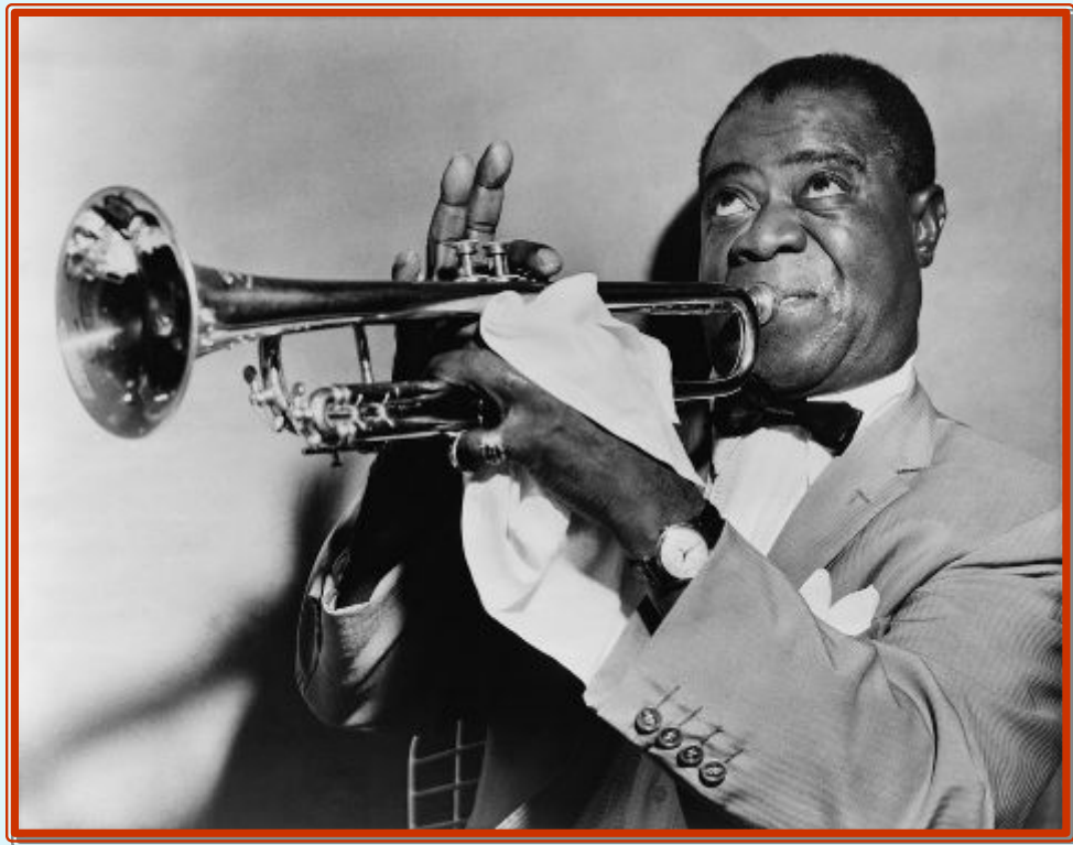
Луи Армстронг (1900 – 1971)

«Если слово «гений» и означает что-то в джазе, то оно означает – Армстронг» (Дж. Коллиер)