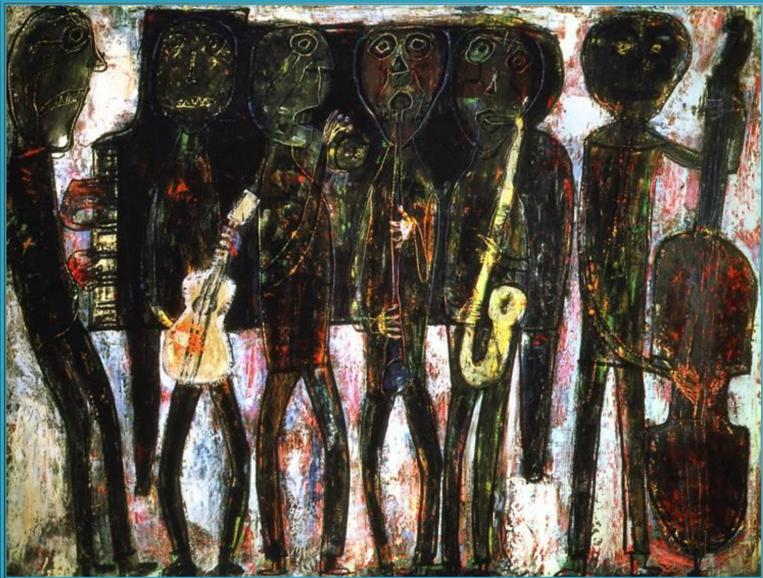
Ж. Дюбюффе «Джаз-банд» (Блюз в непристойном стиле)