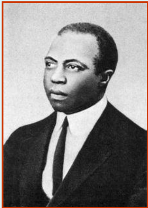
Скотт Джоуплин (1868 – 1917)