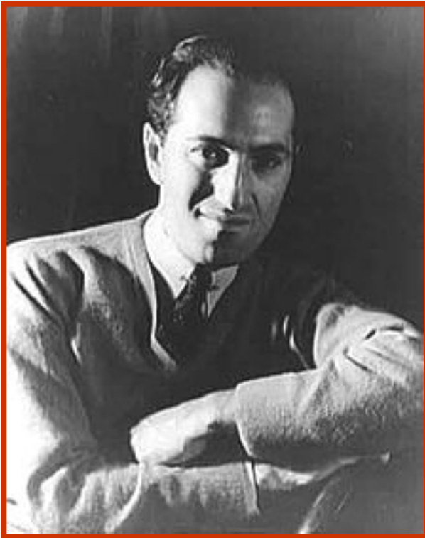
Джордж Гершвин (1898 – 1937)