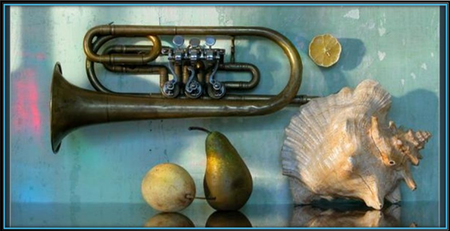
С. Белов «Утренний блюз»