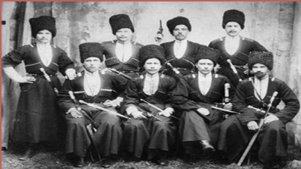
Казачи Сунженского владикавказс кого полка