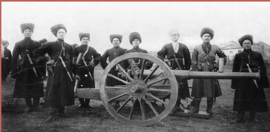
Казачи артелеристы Терской батареи