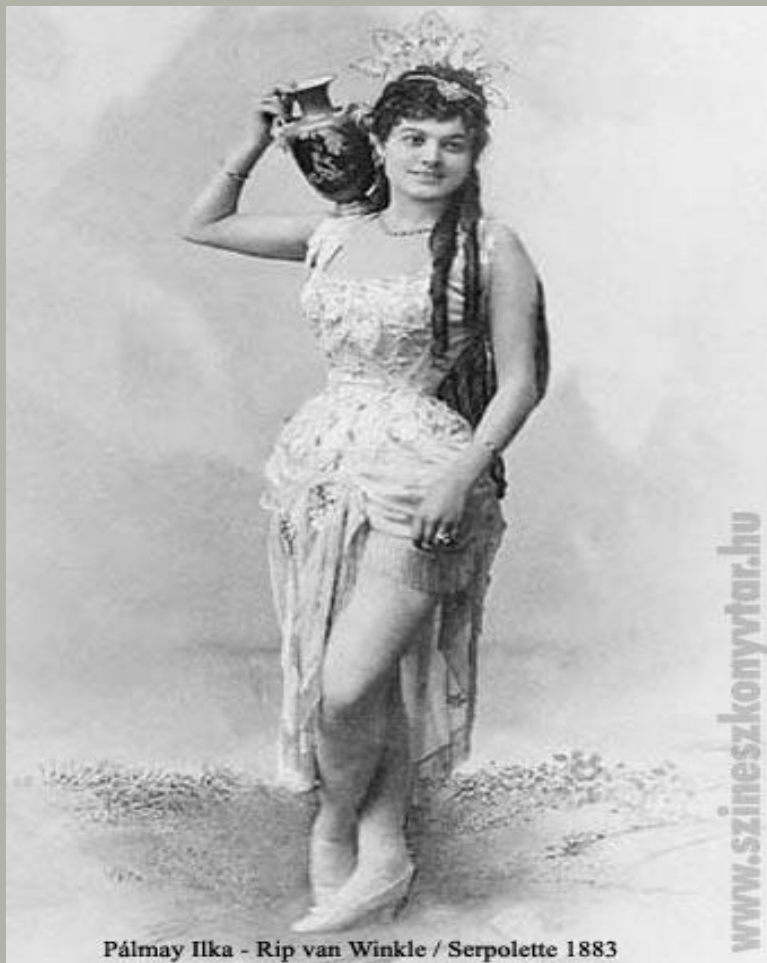
Pálmay Ilka - Rip van Winkle / Serpolette 1883

Оперётта ( итал. operetta , дословно маленькая опера ) — жанр музыкального театра , в котором музыкальные номера чередуются с диалогами без музыки. Оперетты пишутся на комический сюжет , музыкальные номера в них короче оперных , в целом музыка оперетты носит лёгкий, популярный характер, однако наследует напрямую традиции академической музыки .