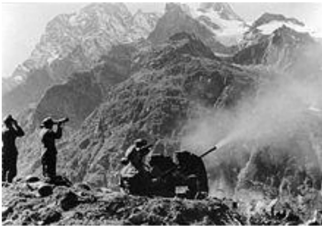
Битва за Сталинград Сентябрь 1942 г.