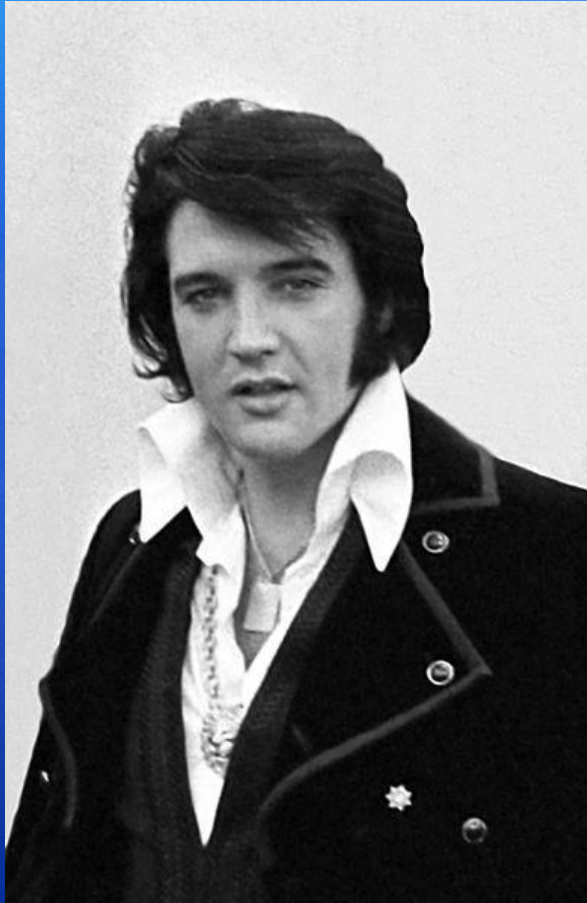
Элвис Пресли – «король рок-н-ролла»