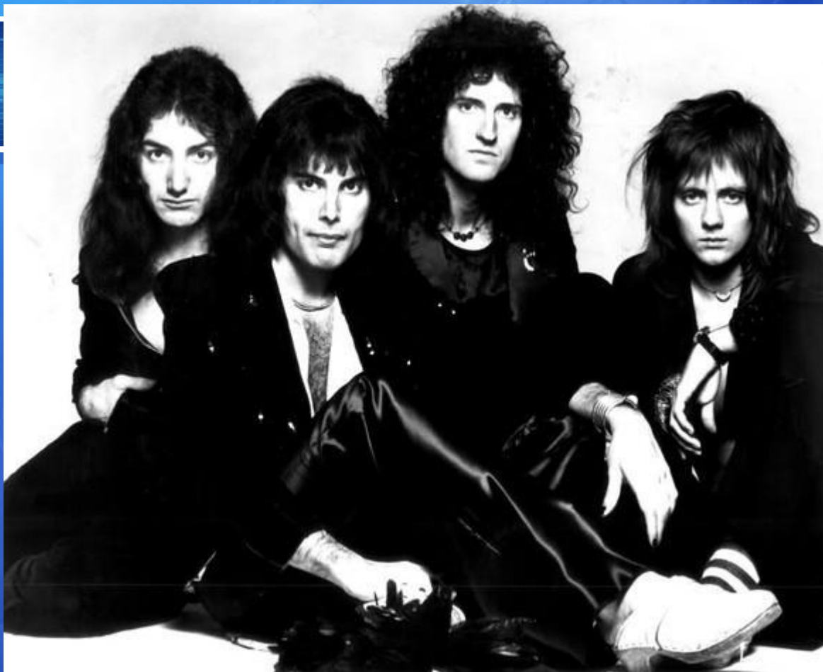
Слева направо: Джон Дикон, Фредди Меркьюри, Брайан Мэй, Роджер Тэйлор.