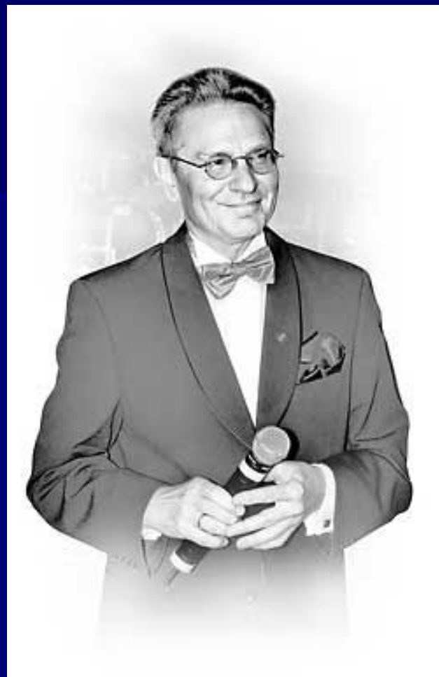
Композитор – Давид Федорович Тухманов