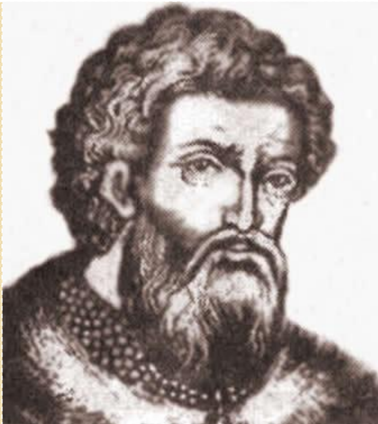
Князь Александр Невский