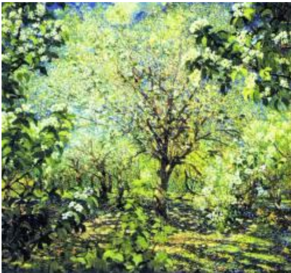
Александр Герасимов. Деревья в цвету

Кинорежиссёр Акира Куросава включает «Неоконченную» симфонию в композицию своего фильма «Великолепное воскресенье» .