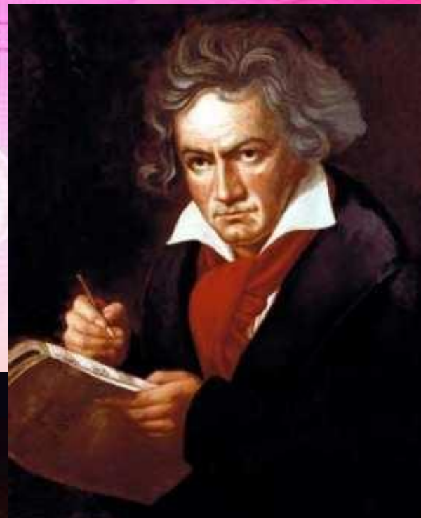
Людвиг ван Бетховен