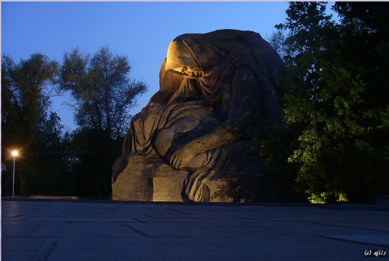
ВОЛГОГРАД, МЕМОРИАЛЬНЫЙ КОМПЛЕКС МАМАЕВ КУРГАН. ПАМЯТНИК СКОРБЯЩЕЙ МАТЕРИ