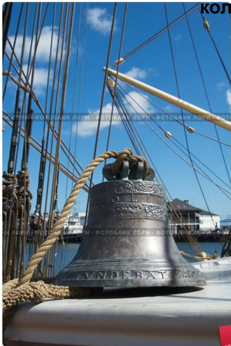
Рында. Корабельный колокол