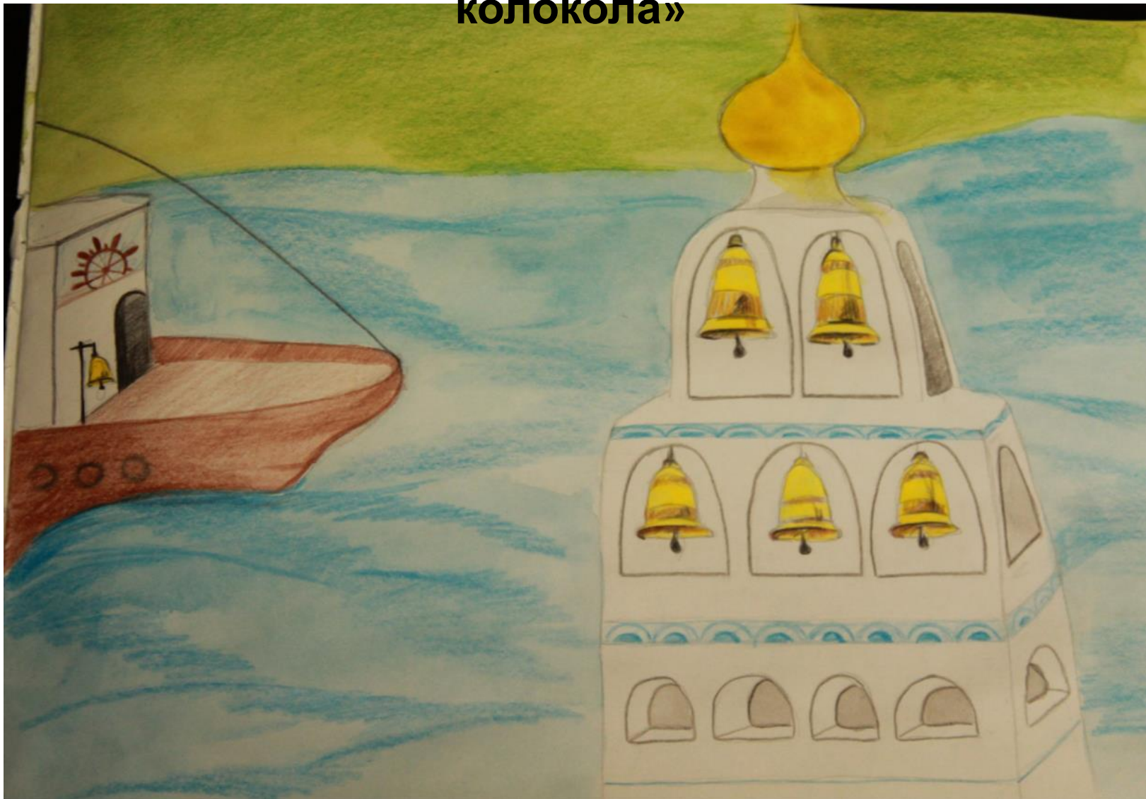
Рисунок Харлова Ильи, ученика 8 класса 2013 – 2014 учебный год