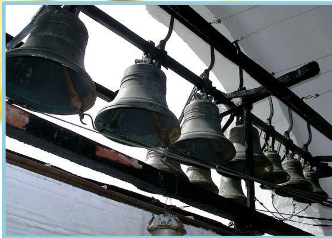
Завонные и подзвонные колокола на колокольне Троице-Сергиевой Лавры

Подзвонные колокола по весу больше завонных. Подзвонных колоколов может быть любое количество. Верёвки (или цепочки), на которые звонарь нажимает при звоне, крепятся одним концом к языкам подзвонных колоколов, а другим к так называемому звонарскому столбику.