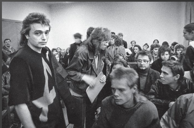
К. Кинчев в зале суда. 1986 г.